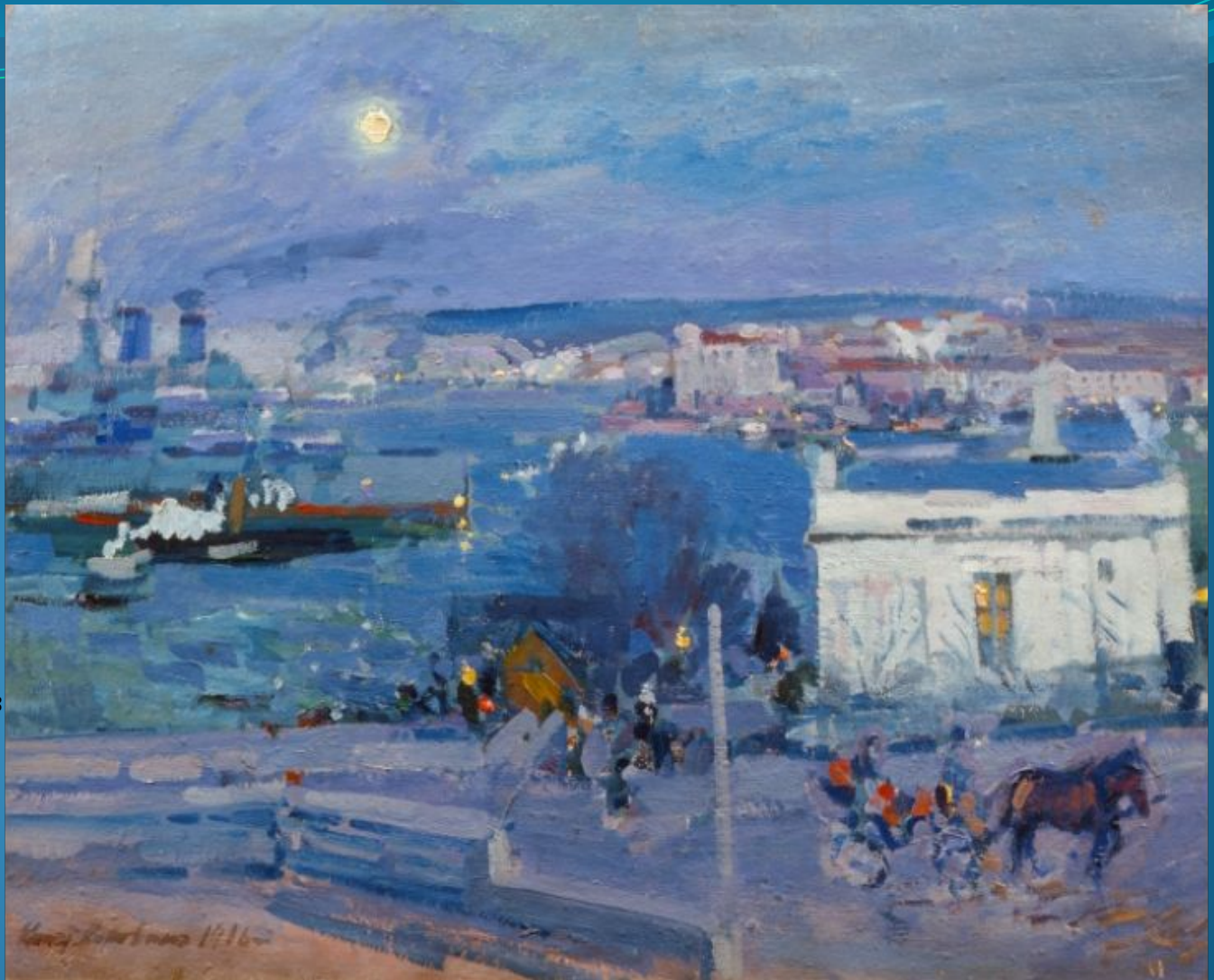
Коровин К. А. Гавань в Севастополе (1916) Краснодарский краевой художественный музей имени Ф. А. Коваленко

Коровин К. А. 1861, Москва – 1939, Париж Живописец, художник театра. Крупнейший русский импрессионист, чьи поиски в течение четырех десятилетий (с 1880-х) определяли облик и пути развития отечественной школы импрессионизма, постоянно обогащая ее новыми приемами образных решений, новыми темами и мотивами. Проявил себя в разных жанрах живописи. Своими картинами и педагогической практикой способствовал широкому распространению идей импрессионизма.