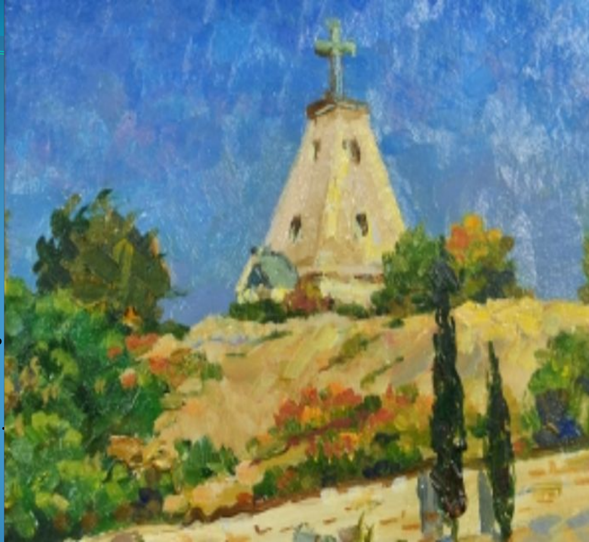
Брусенцов Г. Я. Церковь св. Николая на Братском кладбище в Севастополе (1988) Национальный музей героической обороны и освобождения Севастополя

Живописец и график. Заслуженный художник УССР. Член Союза художников СССР (1954). 1953 г. – окончил факультет монументально- декоративной живописи Ленинградского высшего художественно- промышленного училища им. В. И. Мухиной. Жил и работал в Ашхабаде. 1954–1957 гг. – преподаватель в Ашхабадском художественном училище. С 1969 г. – жил в Севастополе. 1969–1973 гг. – главный художник Севастопольских художественно- производственных мастерских. Участник выставок в Голландии (1972), Японии (1974), Венгрии (1974, 1986).