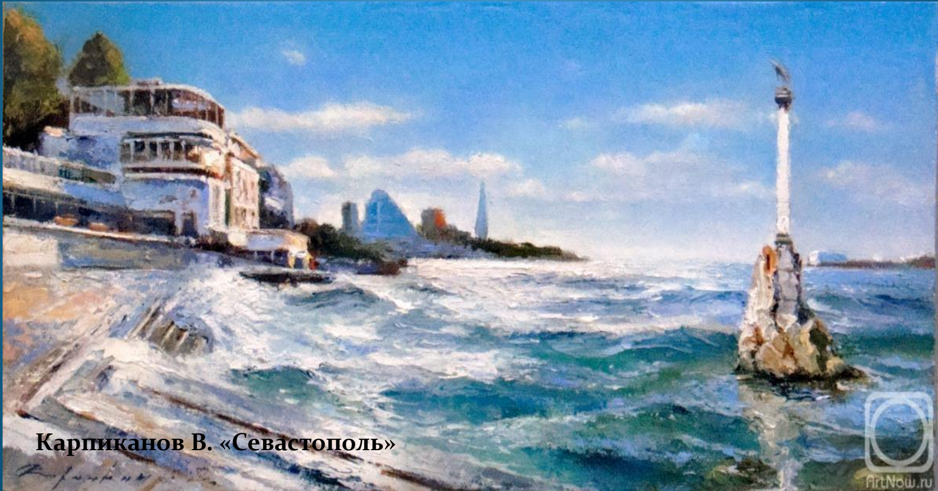
Карпиканов В. «Севастополь»