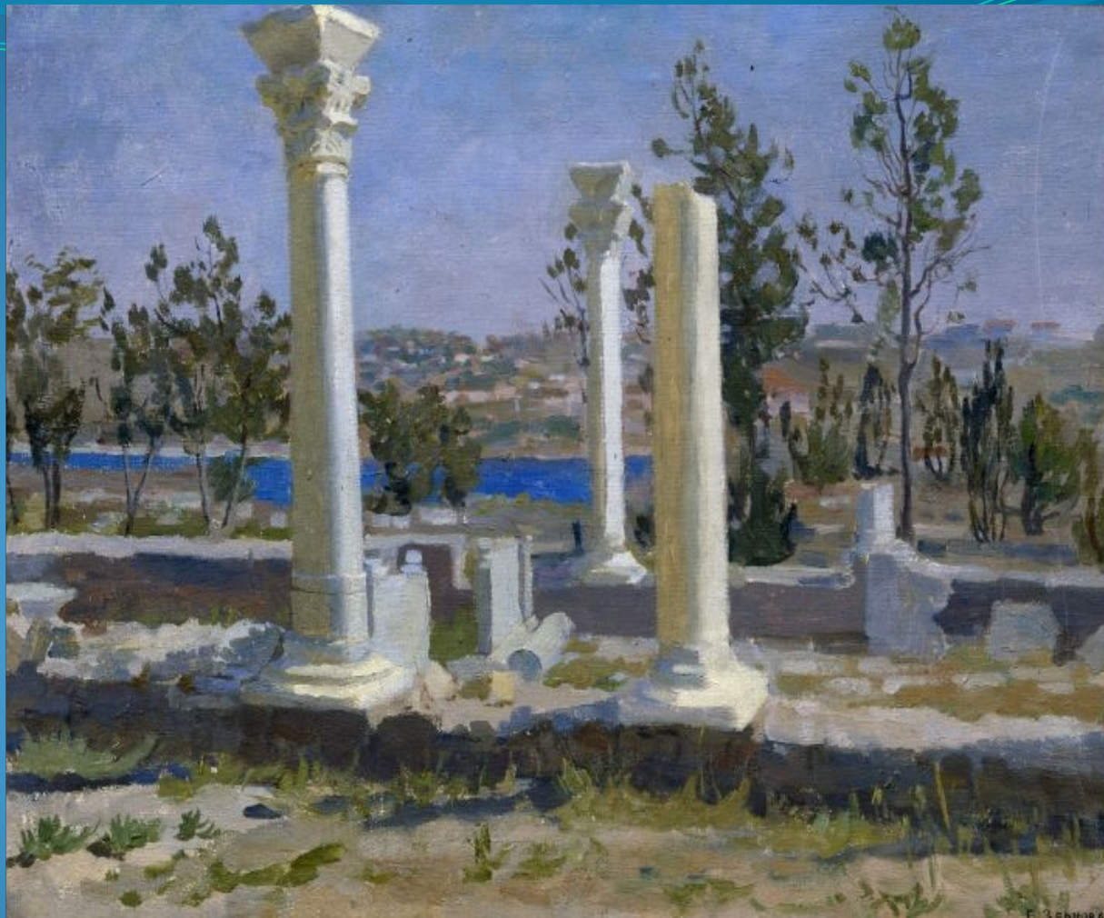
Зернова Е. С. Херсонесская базилика (1946) Севастопольский художественный музей имени М.П. Крошицкого

С 1967 – председатель правления Художественного фонда СССР.