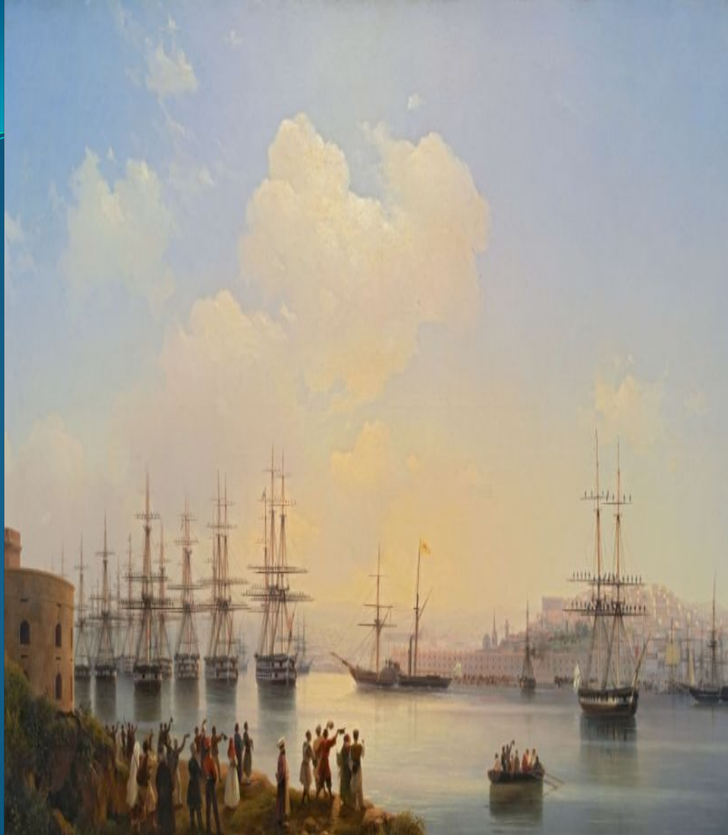
Айвазовский И. К. Русская эскадра на Севастопольском рейде (1846) Государственный Русский музей

Живописец-маринист. Почетный член Императорской Академии художеств с 1887, профессор. Член Римской Академии Св. Луки, Флорентийской, Амстердамской и Штутгартской академий художеств. Кавалер ордена Почетного легиона. Член Русского географического общества. Родился в Феодосии в семье армянского торговца. Учился у феодосийского архитектора Г. Коха, в Императорской Академии художеств у М. Н. Воробьева и Ф. Таннера (с 1833). В 1838–1840 – пенсионер в Италии; посетил Германию, Францию, Испанию и Голландию (1840–1844). Живописец Главного морского штаба. В 1845 совершил путешествие в Турцию, Малую Азию, на Греческий архипелаг с экспедицией Ф. П. Литке. По возвращении жил и работал в Феодосии (почетный гражданин с 1880), подарил городу картинную галерею (ныне Феодосийская картинная галерея имени И. К. Айвазовского). Сыграл большую роль в развитии русской маринистики. Написал около 6000 картин. Автор морских пейзажей, видов приморских городов, картин, посвященных истории отечественного флота, батальных сцен. Создал ряд полотен на библейские сюжеты.