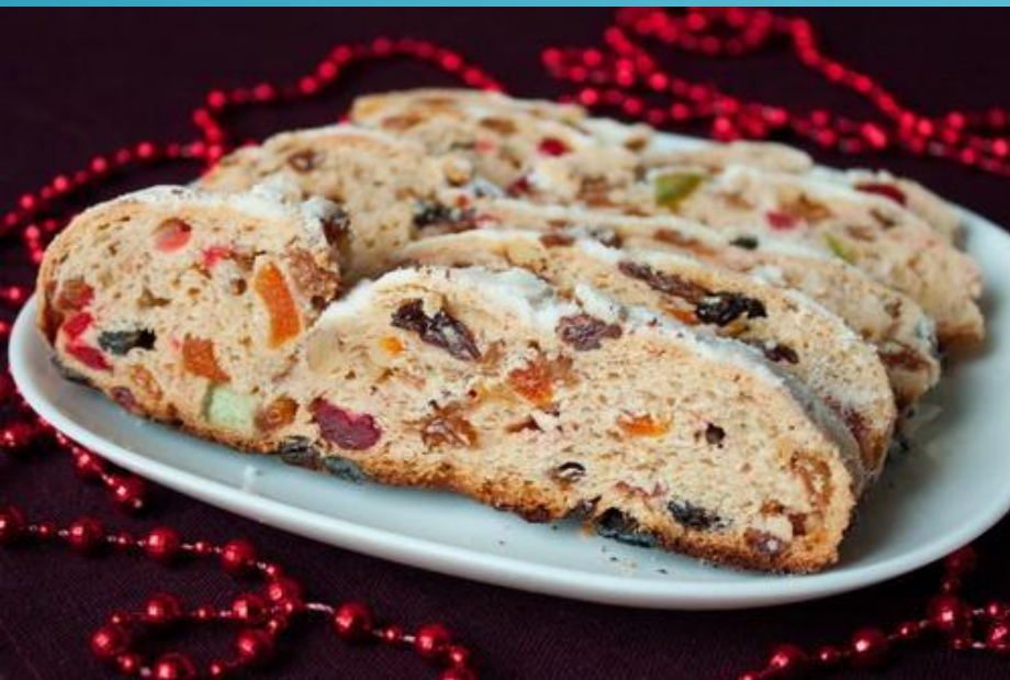
Немецкий фруктовый хлеб — штоллен

ОСОБОЕ МЕСТО В НЕМЕЦКОЙ КУХНЕ ЗАНИМАЮТ ДЕСЕРТНЫЕ БЛЮДА. СЛАДОСТИ ПОРАЖАЮТ МНОГООБРАЗИЕМ: ВОЗДУШНЫЕ БУЛОЧКИ, ПЕСОЧНЫЕ ПИРОЖКИ, ФРУКТОВЫЕ КЕКСЫ, БИСКВИТНЫЕ И ЗАВАРНЫЕ ПИРОЖНЫЕ, РИСОВЫЕ ПУДИНГИ, ВАФЛИ, И ПРЯНИКИ. ЭТО ЛИШЬ НЕБОЛЬШОЙ ПЕРЕЧЕНЬ ОБЫЧНЫХ, ЕЖЕДНЕВНЫХ ДЕСЕРТОВ. НО ЕСТЬ ОСОБЫЕ СЛАДКИЕ ИЗДЕЛИЯ, КОТОРЫЕ ПРИНЯТО ЕСТЬ ТОЛЬКО ПО РОЖДЕСТВЕНСКИМ ПРАЗДНИКАМ. К НИМ ОТНОСИТСЯ ШТОЛЛЕН – ФРУКТОВЫЙ ХЛЕБ. ОН ПРЕДСТАВЛЯЕТ СОБОЙ ТВЕРДЫЕ КЕКСЫ, В ТЕСТО ДЛЯ КОТОРЫХ ДОБАВЛЯЮТ ЦУКАТЫ, ОРЕХИ И МАРЦИПАН. ЕГО ПЕКУТ ЗА МЕСЯЦ ДО УПОТРЕБЛЕНИЯ, И ВЫДЕРЖИВАЮТ ДО ПРИОБРЕТЕНИЯ ИМ ОСОБОГО ВКУСА И АРОМАТА.