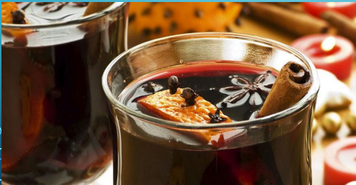
Немецкий глинтвейн с палочкой корицы

ИЗ НАПИТКОВ ПОМИМО ТРАДИЦИОННОГО ПИВА, ПРИГОТАВЛИВАЮЩЕГОСЯ С ОСОБОЙ ЛЮБОВЬЮ И ПО СТАРИННЫМ ТРАДИЦИЯМ, НЕМЦЫ УПОТРЕБЛЯЮТ СИДР, ШНАПС И ГЛИНТВЕЙН. ПОПУЛЯРНОСТЬЮ ПОЛЬЗУЮТСЯ И ХОРОШИЕ ВИНА.