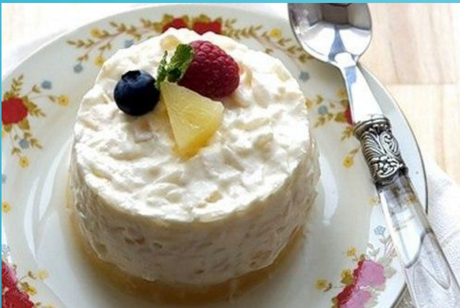
Немецкий рисовый пудинг