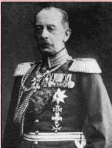
Альберт фон Шлиффен

стратегический план командования Германской империи, который был разработан в начале XX века, чтобы одержать быструю победу в Первой мировой войне на Западном фронте в войне с Францией, и в войне с Россией на Восточном. В последующей, измененной вариации, план был предназначен для победы в течение первого месяца Первой мировой войны; но неудачные изменения первоначального плана, некоторые тактические просчёты, а также на удивление быстрое наступление русской армии завершило немецкое наступление, и вылилось в годы позиционной войны.