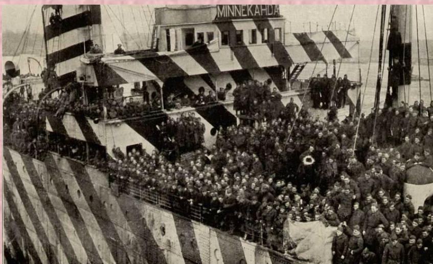
Победоносные американские войска возвращаются домой

11 ноября 1918 г. в 11 часов раздался первый залп артиллерийского салюта в 101 выстрел. Первая мировая война закончилась.