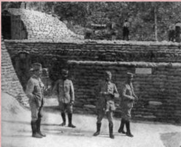
Французские оборонные сооружения, Сомма, 1916 г.