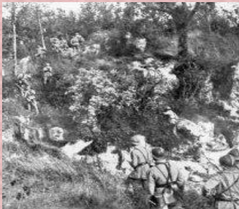
Французский патруль. Марна, 1918 г.