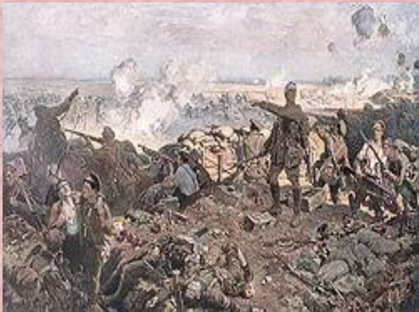
Вторая битва при Ипре