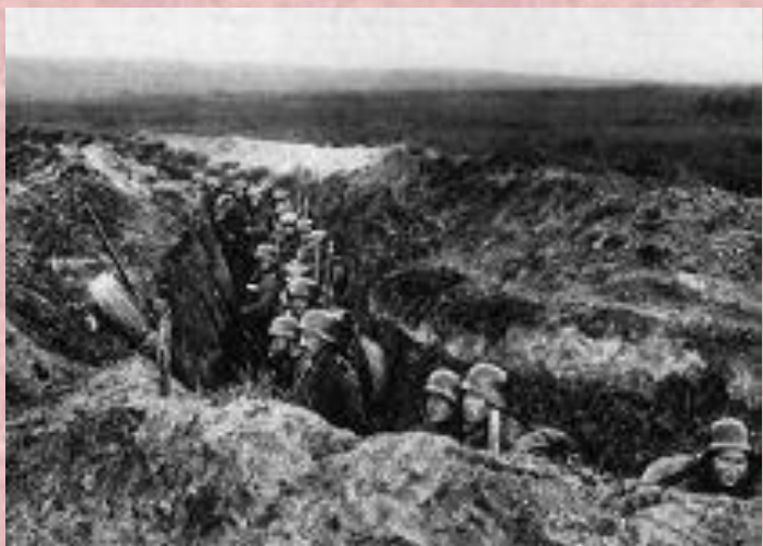
Германские окопы, июль 1918 г.