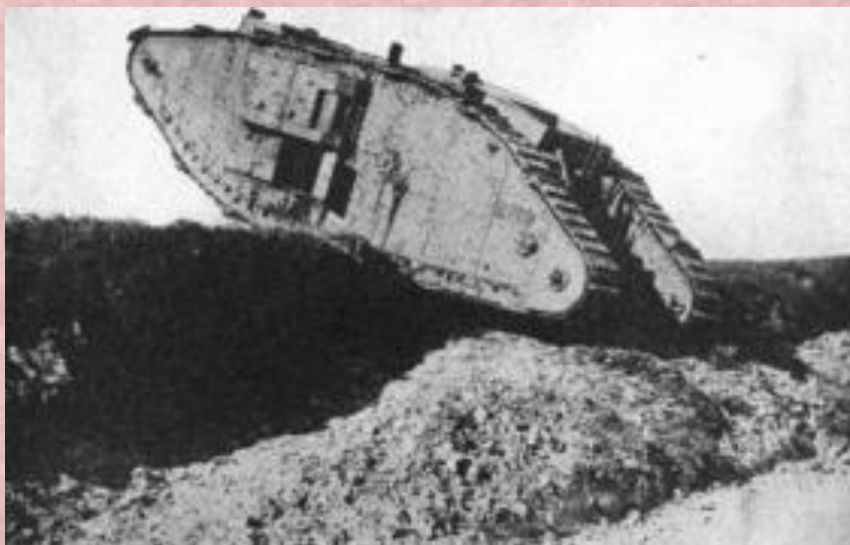
Британский танк пересекает германскую траншею