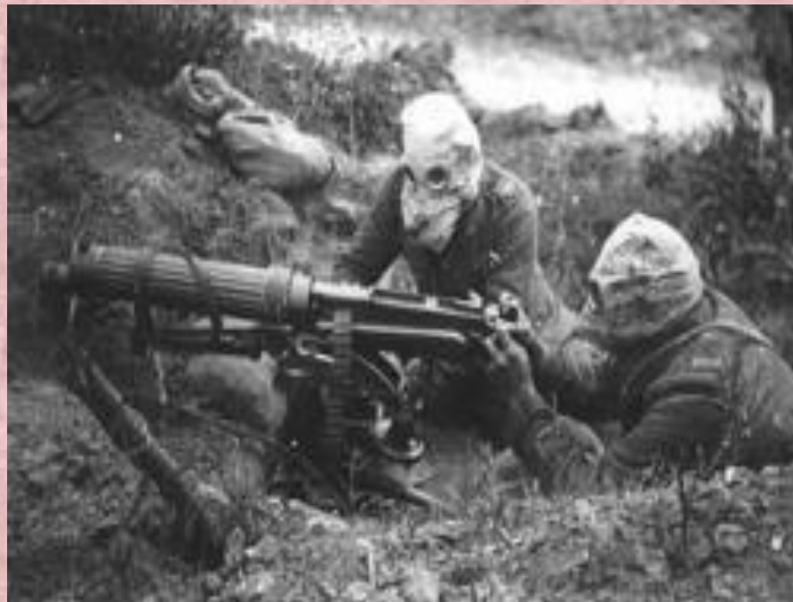
Британские солдаты отражают контратаку