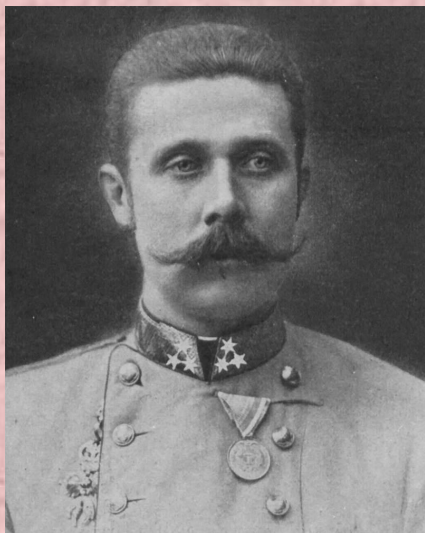
Эрцгерцог Франц Фердинанд

Общепринято, что непосредственно поводом к началу военных действий явилось Сараевское убийство 28 июня 1914 г. эрцгерцога Франца Фердинанда сербским националистом Гаврило Принципом.