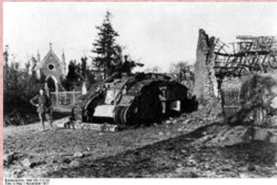
Подбитый английский танк