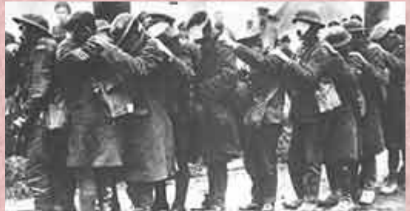
Пострадавшие от газовой атаки английские солдаты