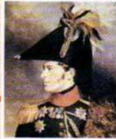
А. С. Меншиков