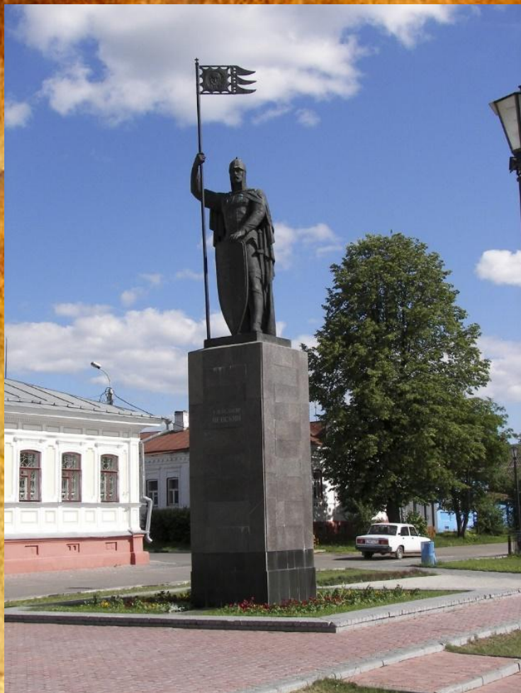
Памятник Святому Благоверному князю Александру Невскому. Установлен в 1993 году