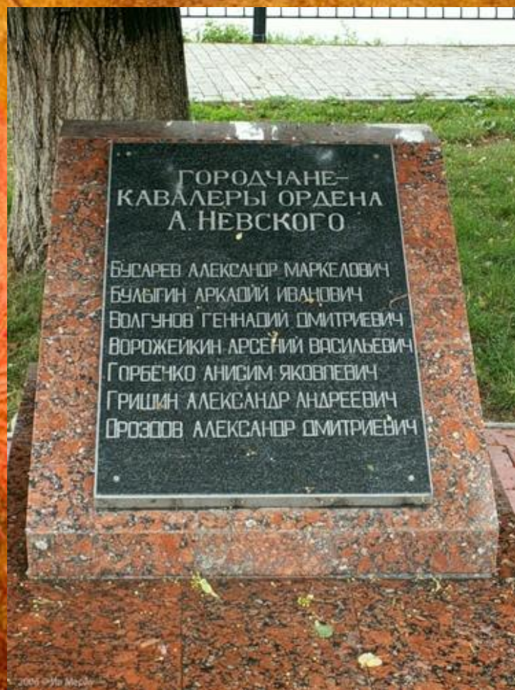
Мемориальная плита городчанам- кавалерам ордена Александра Невского. Установлена в 2000 году.