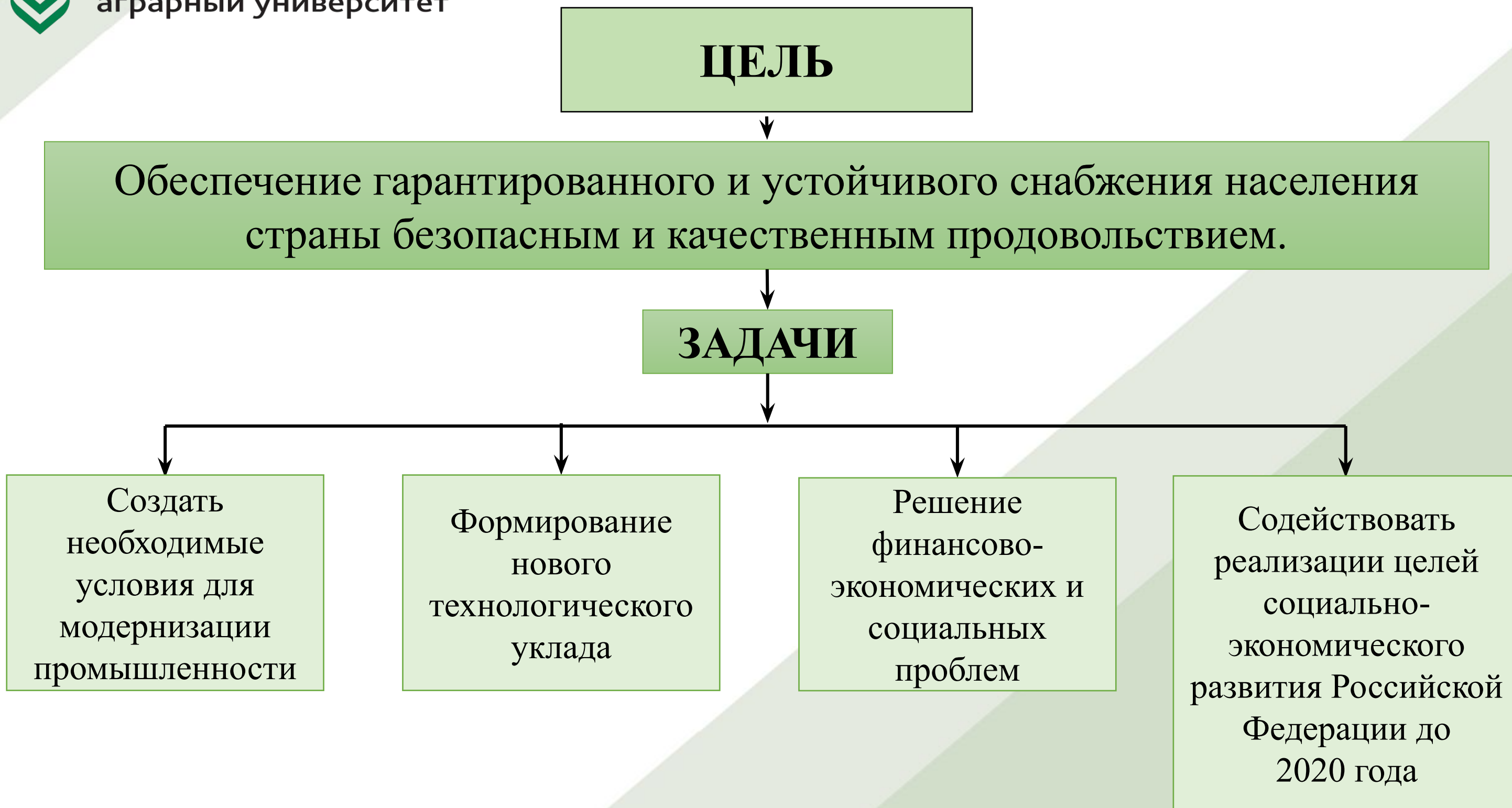
Рисунок 2 – Цель и задачи Стратегии развития пищевой и перерабатывающей промышленности