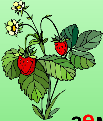
зе м л я ника