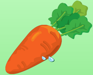
м о рковь