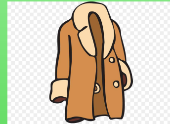
п а льто