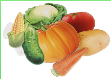
ов о щи