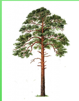
со с на