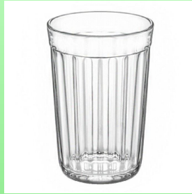
ст а кан