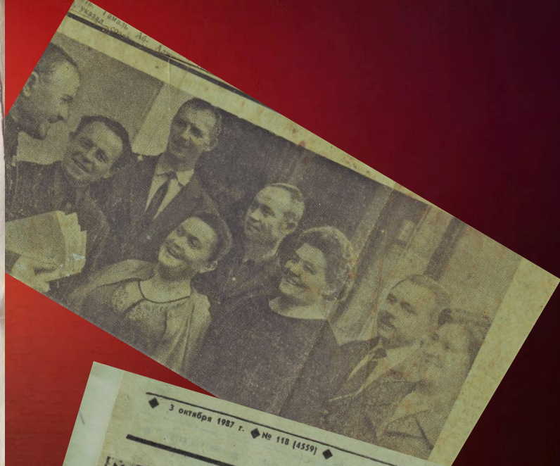
3 октября 1987 г. № 118 [4559]