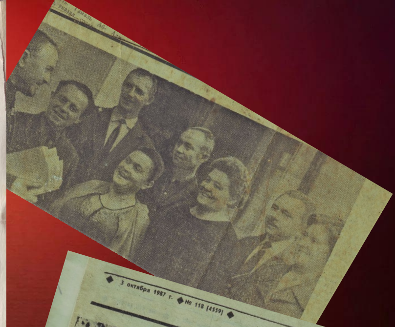
3 октября 1987 г. № 118 [4559]