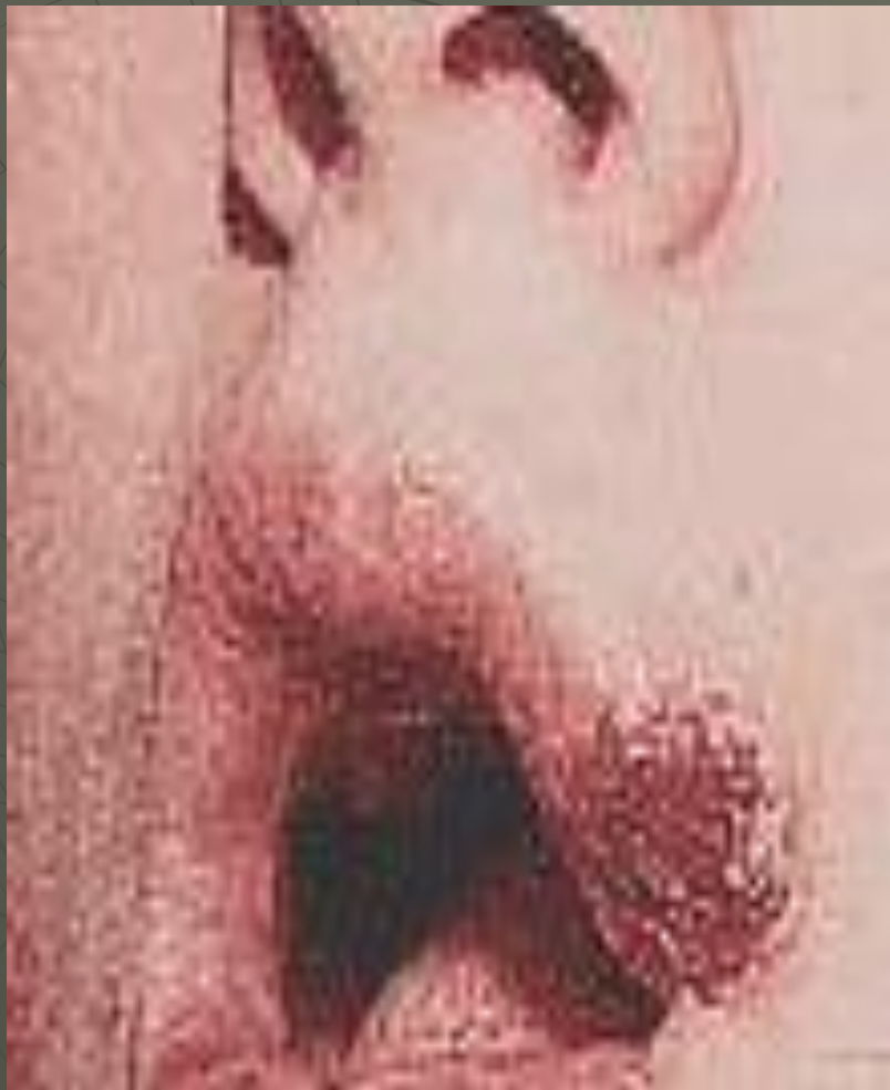
Твердый шанкр на верхней губе человека, больного сифилисом.