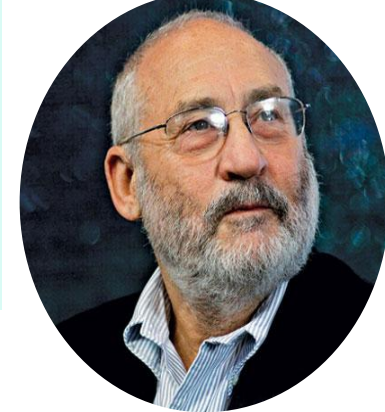
Джозеф Стиглиц, лауреат Нобелевской премии по экономике, 2001 г.