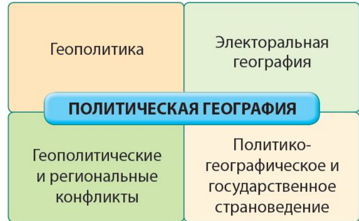
Основные направления политической географии

Суверенитет – независимость государства во внешних или внутренних делах; основной принцип современного международного права и международных отношений.