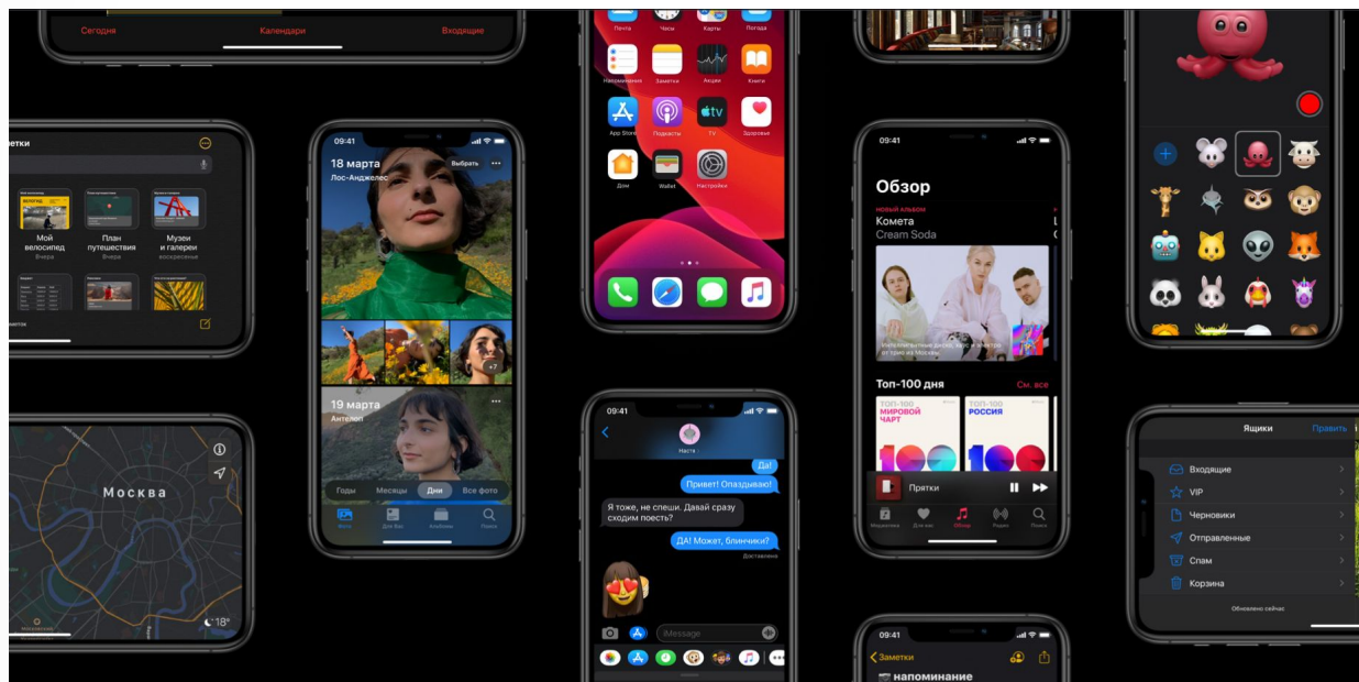
Реклама iOS 13

Агрегативные коммуникации – это интернет коммуникации и любой уровень коммуникации с неограниченным количеством человек, вне зависимости от времени, территории и языка.