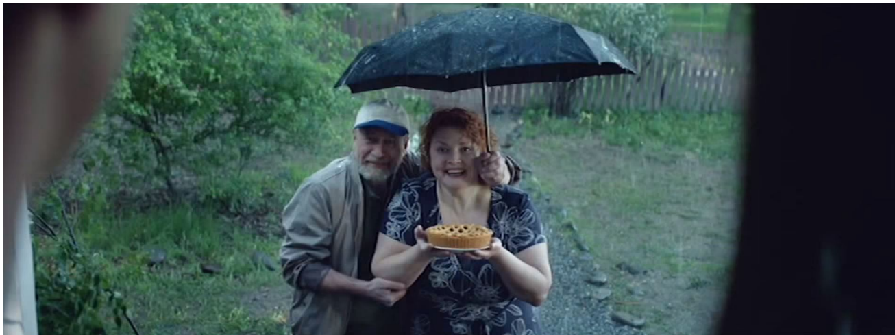
Реклама МегаФон "Соседи"

Между группой коммуникаторов возникают межличностные отношения, а так же личная коммуникация, но всегда имеется присутствие лидера.