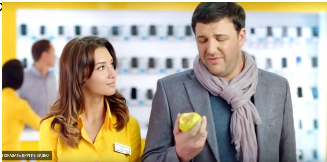
«Евросеть» рекламная кампания Samsung Galaxy S4 mini

Организационная коммуникация – область исследований в теории коммуникации, затрагивающая взаимоотношения организаций между собой и другими формами общественно