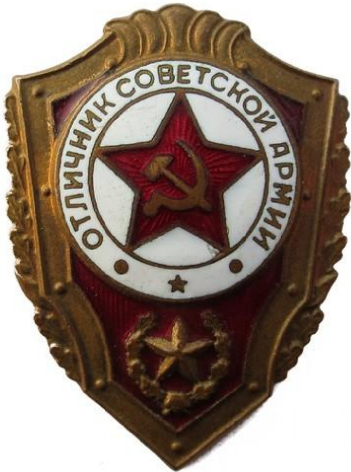
знак гвардии отличник Советской Армии.