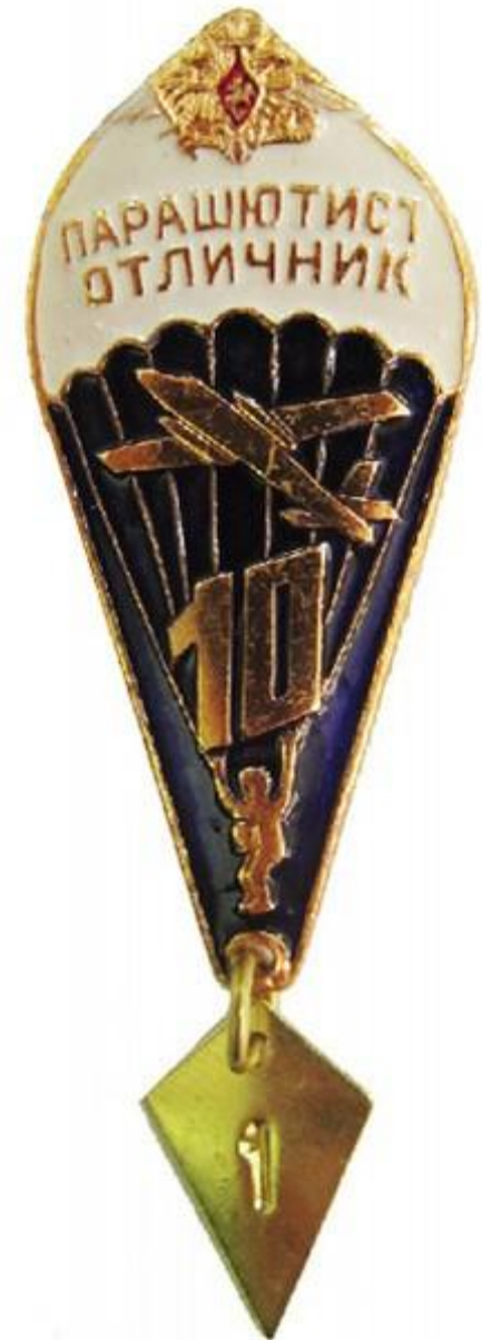
знак парашютист отличник