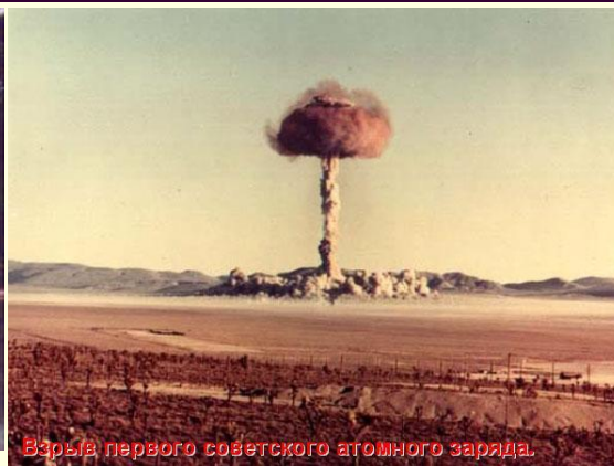
Взрыв первого советского атомного заряда.