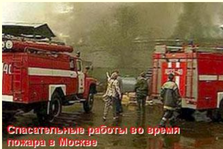
Спасательные работы во время пожара в Москве

Цель создания системы – объединение усилий центральных органов федеральной исполнительной власти, органов представительной и исполнительной власти субъектов РФ, городов и районов, а также организаций, учреждений и предприятий, их СИС в области предупреждения и ликвидации ЧС