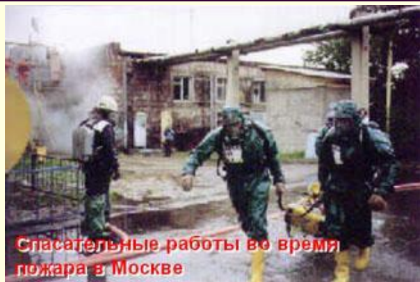
Спасательные работы во время пожара в Москве