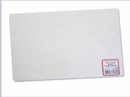
Доска для лепки