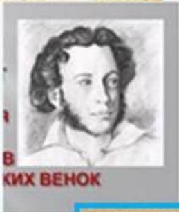
В... КИХ ВЕНОК