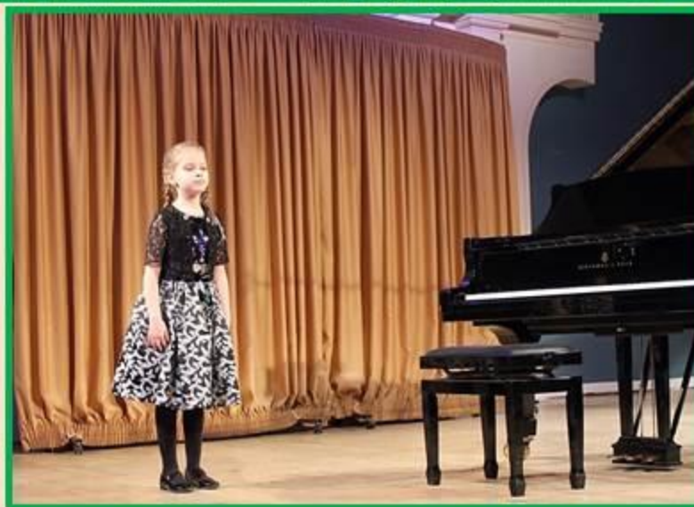
85 участников из 23 городов России и Украины