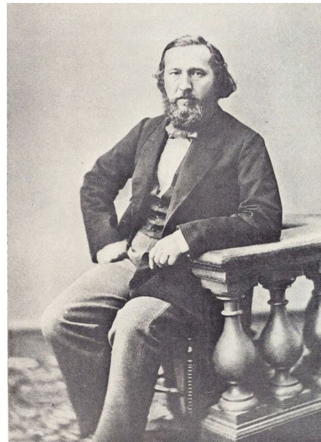
И. В. Киреевский В