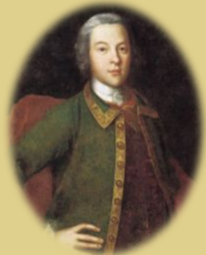
П. И. Панина

В июле - октябре 1770 г. русским войскам сдались крепости Измаил, Килия, Аккерман. В сентябре генерал П.И. Панин взял Бендеры.