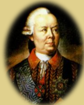
П. А. Румянцева

21 июля началось знаменитое сражение на реке Кагул, где 17-тысячному отряду Румянцева удалось разбить почти 80-тысячные силы противника.