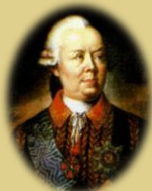
П. А. Румянцев

Турки оставили на поле сражения более 1000 чел., русские потеряли убитыми лишь 29 человек.