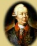
П. А. Румянцев

В 1771 г. русские войска под командованием князя В. М. Долгорукого вступили в Крым и в течение нескольких месяцев захватили основные его пункты.