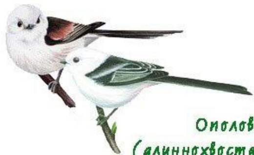
Ополовник (длиннохвостая синица)