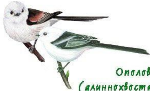
Ополовник (длиннохвостая синица)