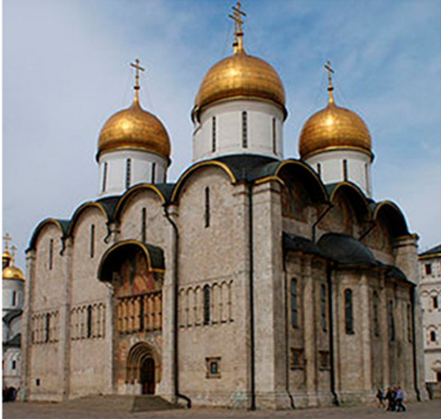
Успенский собор Московского Кремля