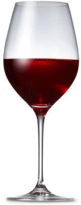
Le vin rouge