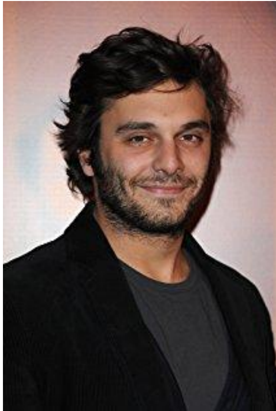
Pio Marmai Jean