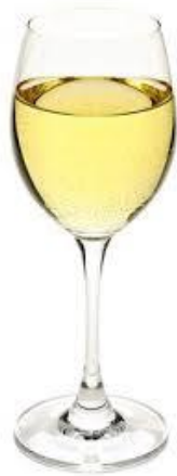
Le vin blanc