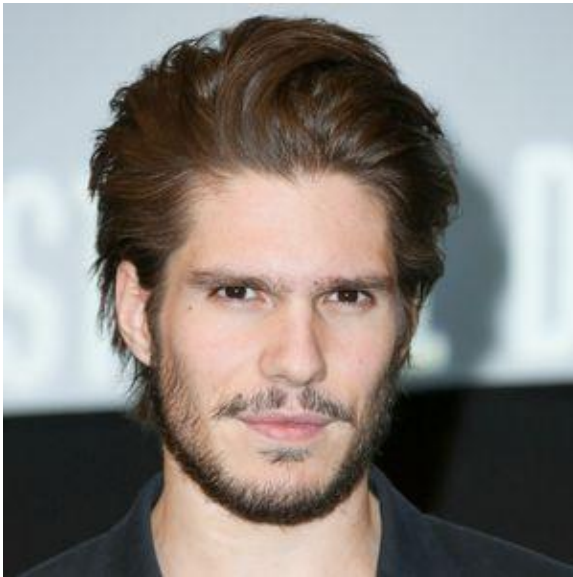
François Civil Jérémie