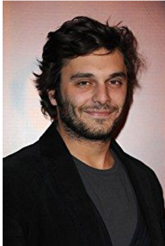
Pio Marmai Jean