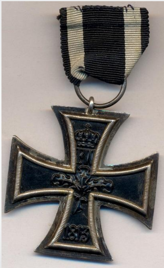
Единственная солдатская награда в Пруссии – железный крест малый солдатский.