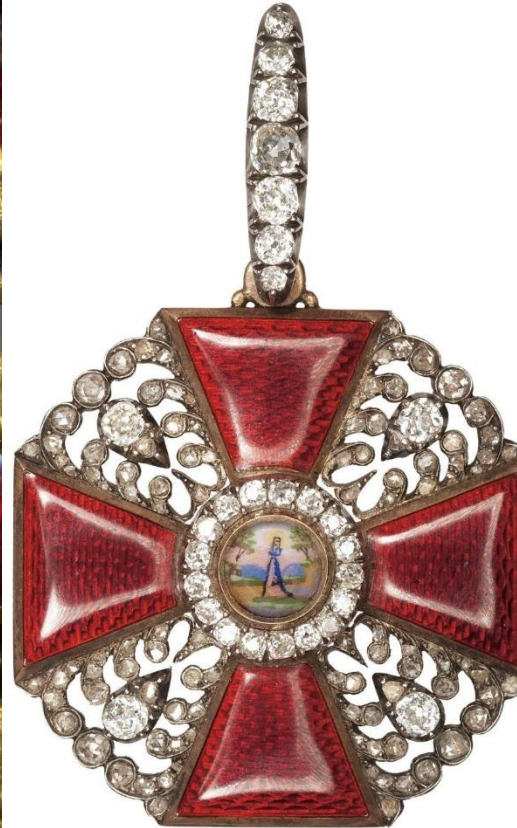
Особая награда алмазный знак Святой Анны.