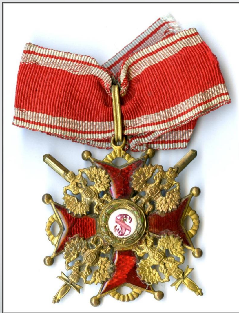
Орден Святого Станислава. Шейный крест.