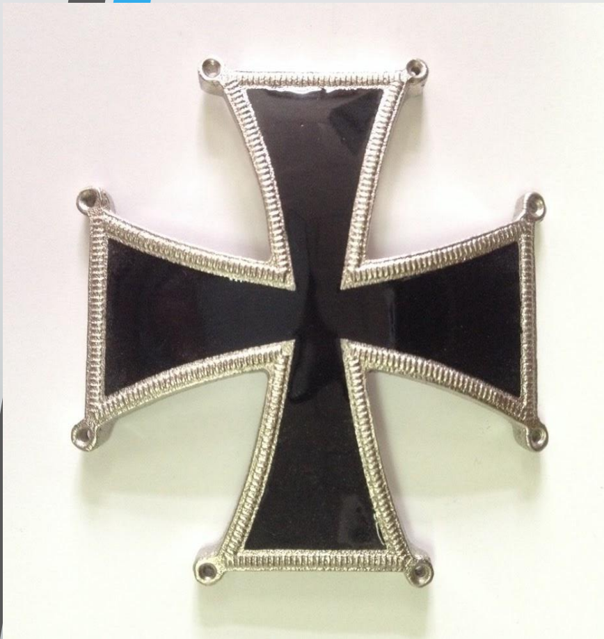
Кульмский крест. Прусская награда для солдат (в том числе и русских), которые проявили героизм в сражении под Кульмом 1814 года. За основы послужил солдатский Железный крест.