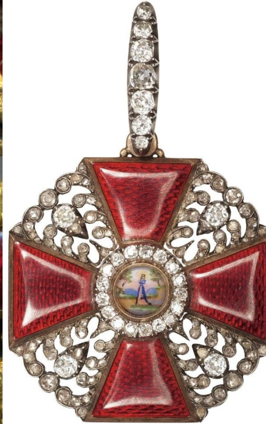
Особая награда алмазный знак Святой Анны.