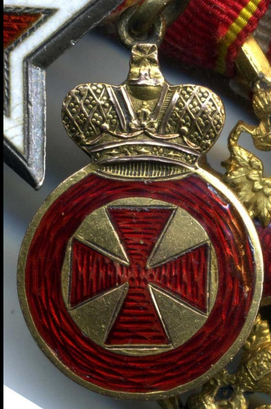
4 степень - наградное оружие. «За храбрость.»