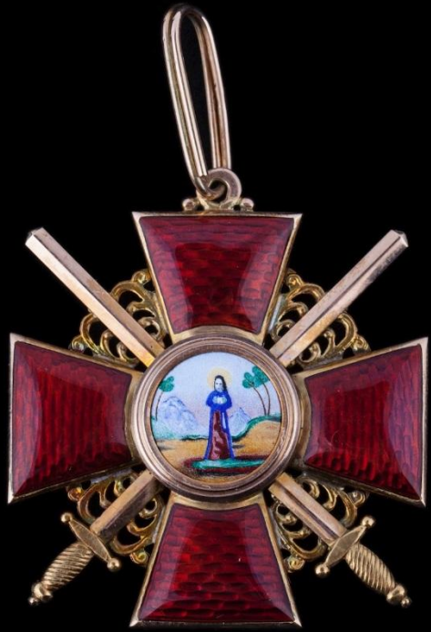
Крест за военные заслуги.