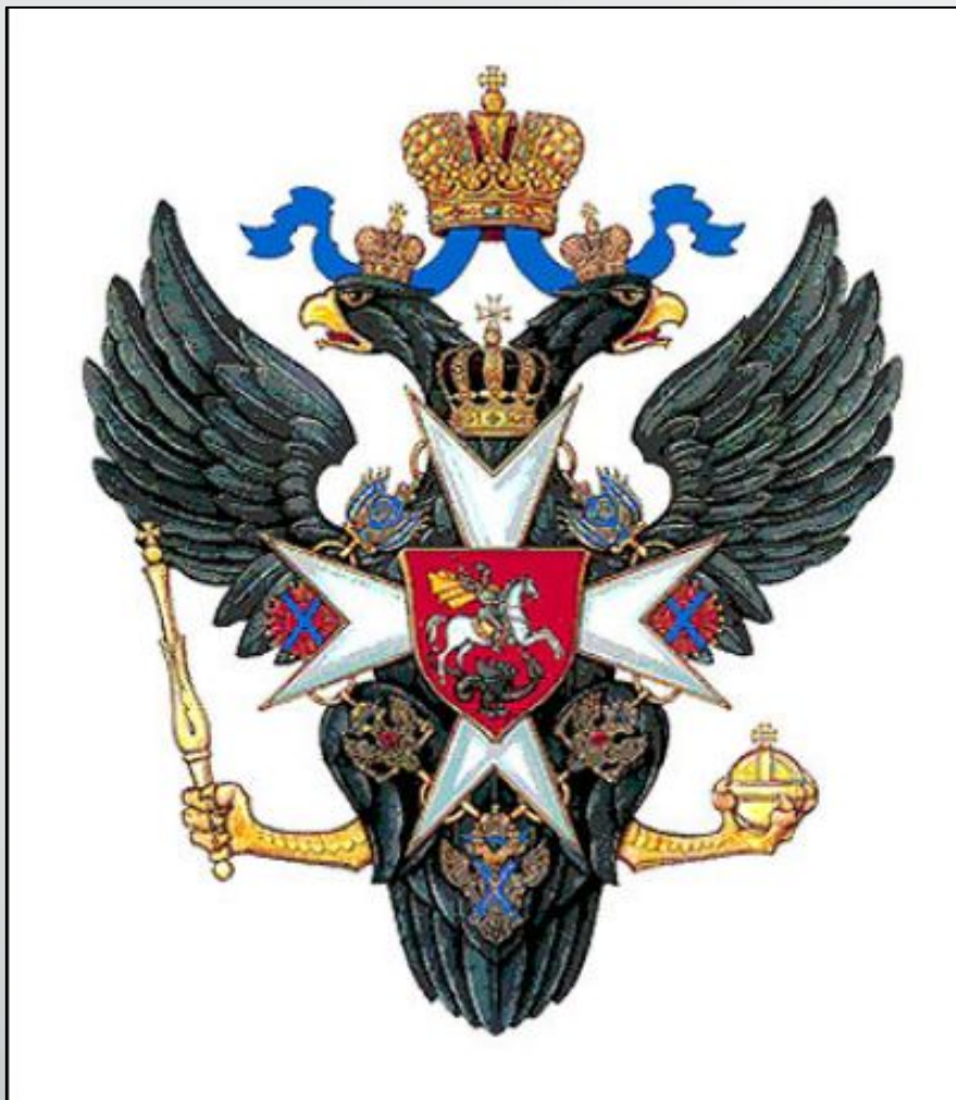
Герб Росси при Павле 1. Одна из деталей – мальтийский крест.