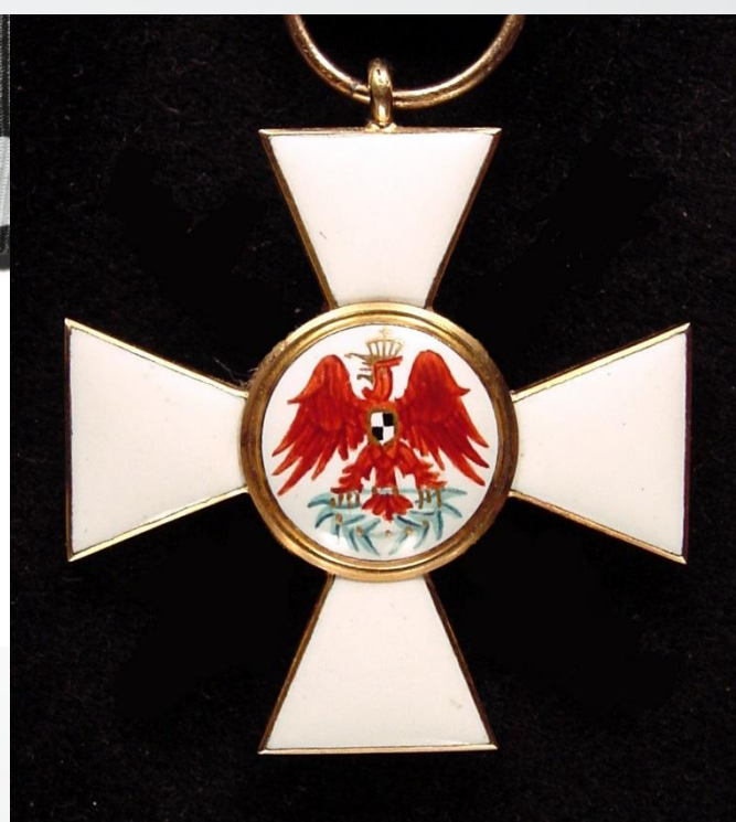
Орден Красного Орла. Аналог Георгиевского креста. Им в России награждён Михаил Илларионович Голенищев-Кутузов.