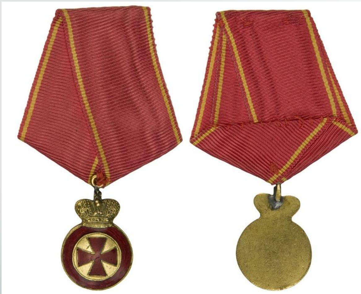
Медаль ордена Святой Анны «За храбрость» (реверс и аверс)