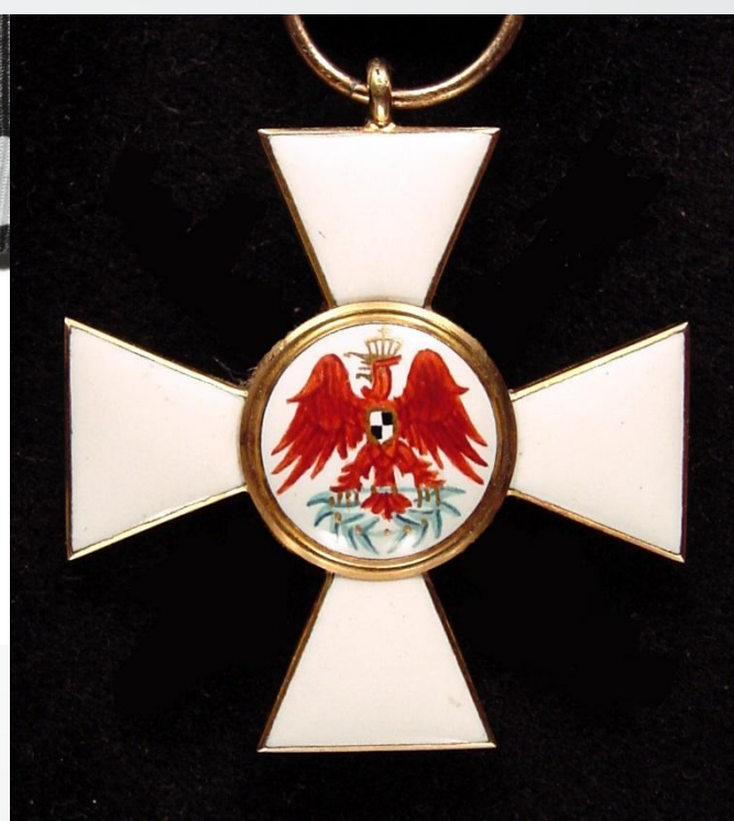
Орден Красного Орла. Аналог Георгиевского креста. Им в России награждён Михаил Илларионович Голенищев-Кутузов.