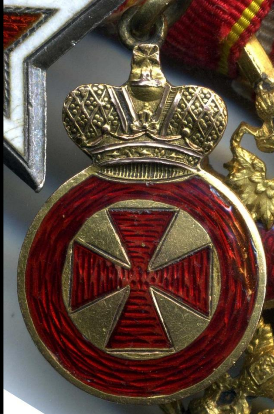
4 степень - наградное оружие. «За храбрость.»