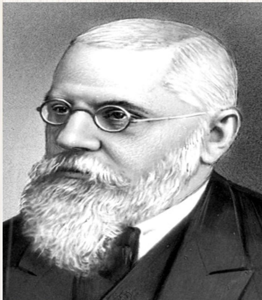
М. Н. Покровский (1868-1932)