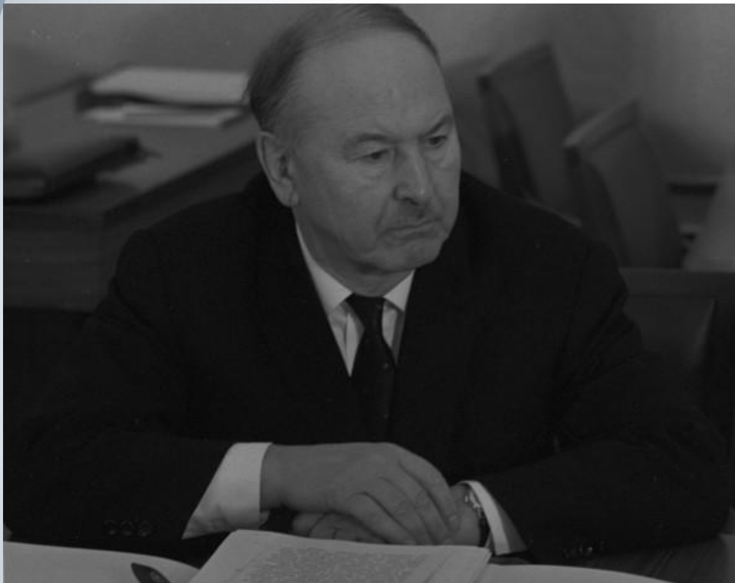
Б. Н. Пономарёв (1905-1995)