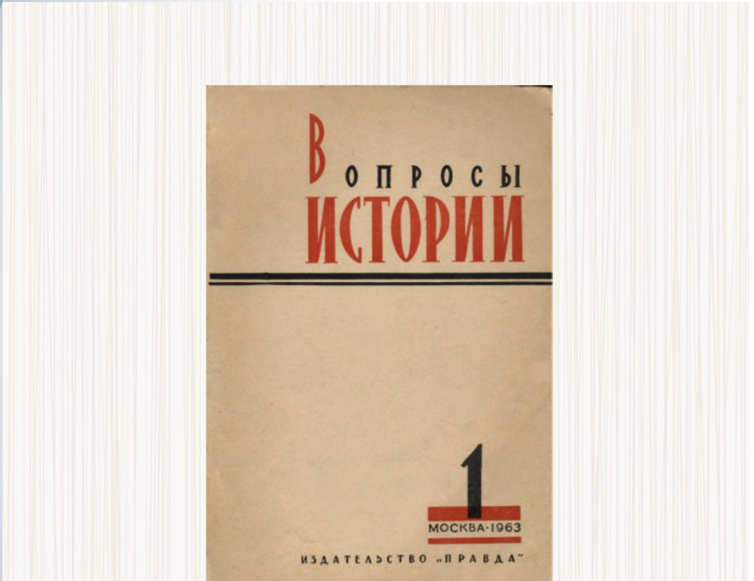
Журнал "Вопросы истории"