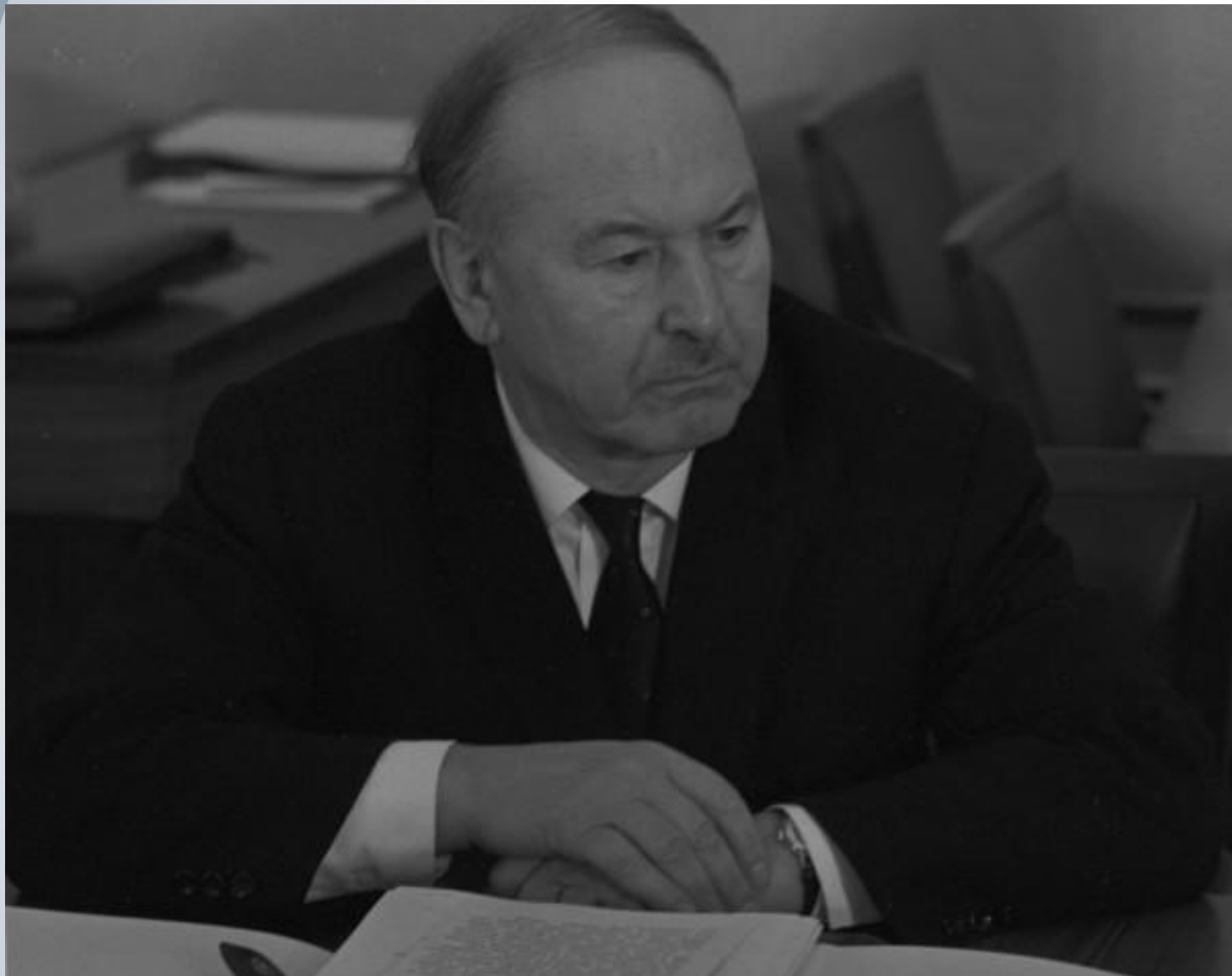
Б. Н. Пономарёв (1905-1995)