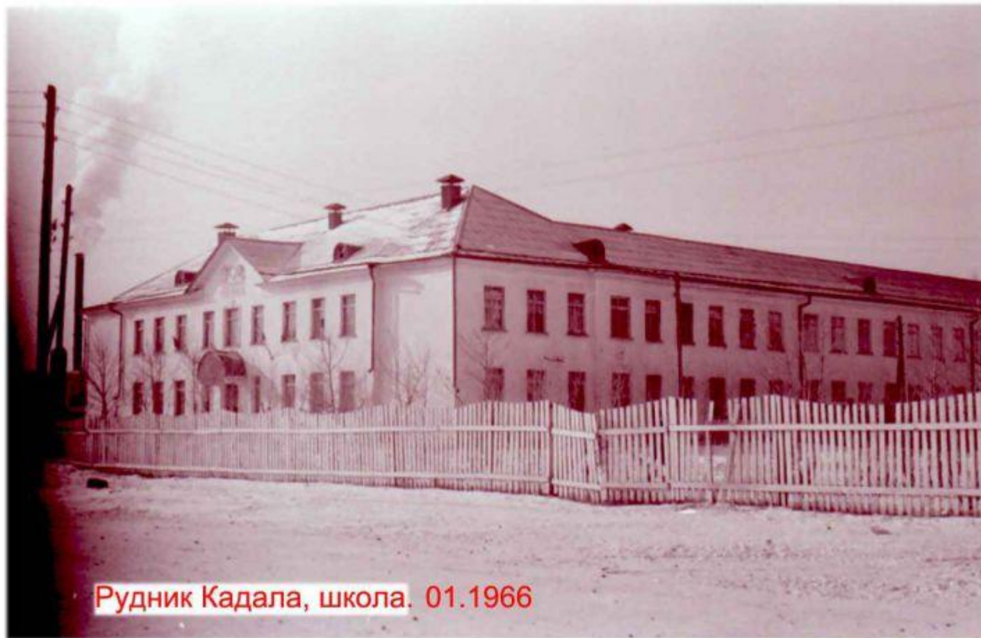
Рудник Кадала, школа. 01.1966