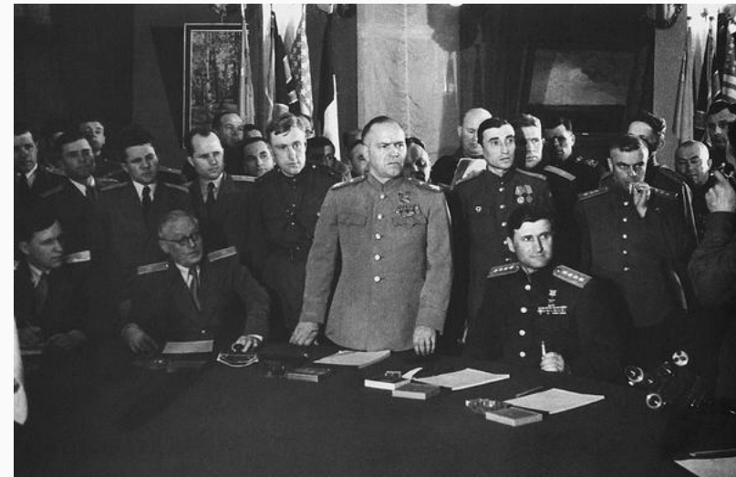
Подписание акта капитуляции Германии.