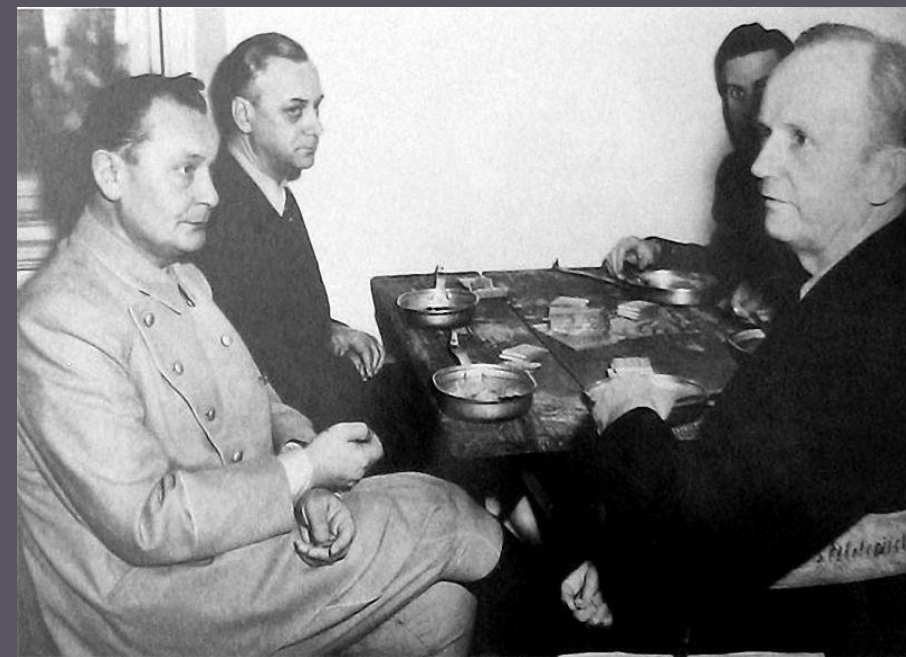
Герман Геринг за обедом во время Нюрнбергского процесса 1946

Евгений Халдей: «Однажды к нам пришел американский шеф-фотограф и сказал, что если у нас есть при себе вспышки, то мы можем пройти с ним. Нас привели в помещение, примерно 40 квадратных метров. У стены стояли столы, света не было. За каждым столом сидело по четыре человека. Тут на снимке — Геринг, Розенберг, адмирал Денитц и фон Ширах. Кейтель сидел вместе Йодлем. Я прошел вдоль стены с моей камерой и снимал со вспышкой. Кейтель закрыл лицо рукой. Затем я подошел к столу с Герингом. Пока шли другие фотографы — американцы и французы — он ничего не говорил. Но как только увидел мою русскую униформу, то начал кричать. “Что такое, уже нельзя спокойно поесть!” Он меня напугал. Тут подошел американский лейтенант и спросил, в чем дело, почему Геринг орет. Понятия не имею, говорю. Я хотел всего лишь сфотографировать. Лейтенант подошел к Герингу и сказал, чтобы он прекратил орать. Но тот не унимался. Тогда лейтенант поднял дубинку и дал Герингу по затылку. После этого стало тихо.»