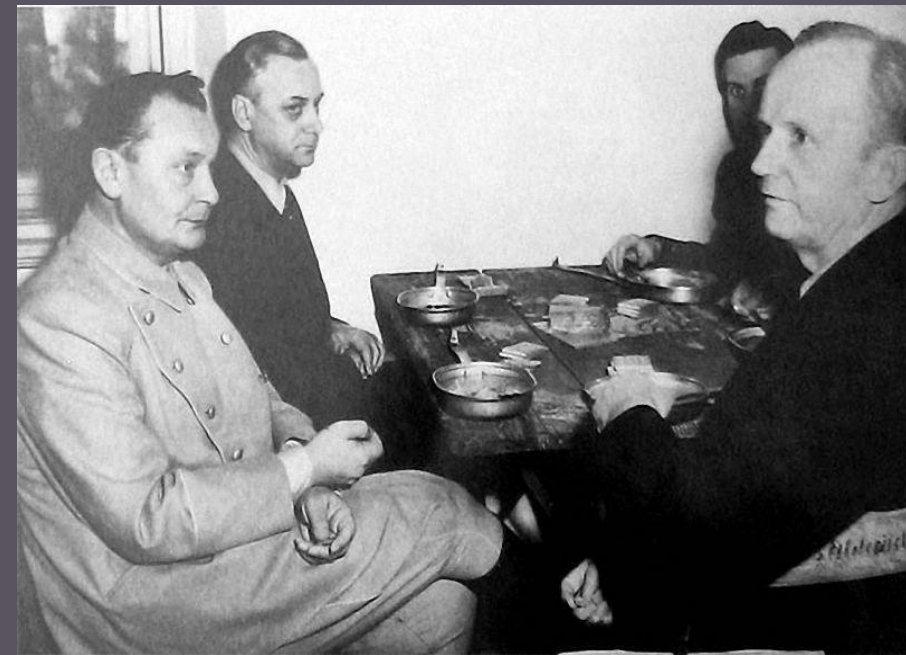
Герман Геринг за обедом во время Нюрнбергского процесса 1946

Евгений Халдей: «Однажды к нам пришел американский шеф-фотограф и сказал, что если у нас есть при себе вспышки, то мы можем пройти с ним. Нас привели в помещение, примерно 40 квадратных метров. У стены стояли столы, света не было. За каждым столом сидело по четыре человека. Тут на снимке — Геринг, Розенберг, адмирал Денитц и фон Ширах. Кейтель сидел вместе Йодлем. Я прошел вдоль стены с моей камерой и снимал со вспышкой. Кейтель закрыл лицо рукой. Затем я подошел к столу с Герингом. Пока шли другие фотографы — американцы и французы — он ничего не говорил. Но как только увидел мою русскую униформу, то начал кричать. “Что такое, уже нельзя спокойно поесть!” Он меня напугал. Тут подошел американский лейтенант и спросил, в чем дело, почему Геринг орет. Понятия не имею, говорю. Я хотел всего лишь сфотографировать. Лейтенант подошел к Герингу и сказал, чтобы он прекратил орать. Но тот не унимался. Тогда лейтенант поднял дубинку и дал Герингу по затылку. После этого стало тихо.»