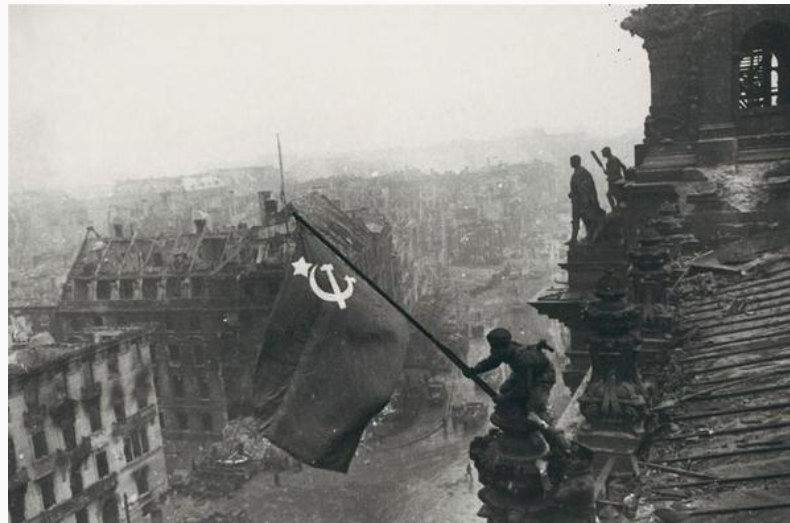
Знамя Победы над Рейхстагом. Берлин. 2 мая 1945