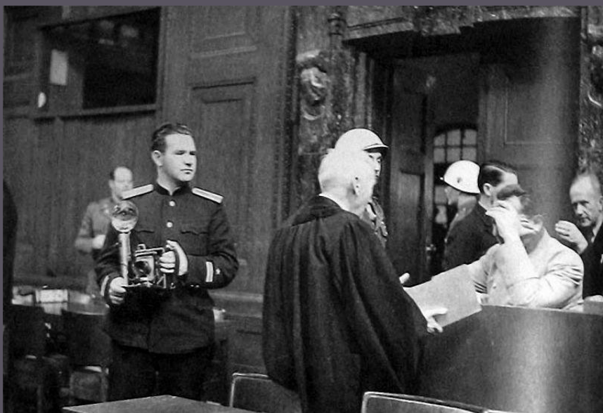
Евгений Халдей на Нюрнбергском процессе рядом с Германом Герингом 1946

Евгений Халдей с камерой Speed Graphic, подаренной ему Робертом Капой — легендарным американским фотографом, одним из основателей агентства Magnum. Халдей сказал, что Геринг не забыл об ударе дубинкой и специально прикрыл лицо ладонью, когда заметил, что русский фотограф хочет попасть с ним в один кадр. Нюрнберг, 1946 г.