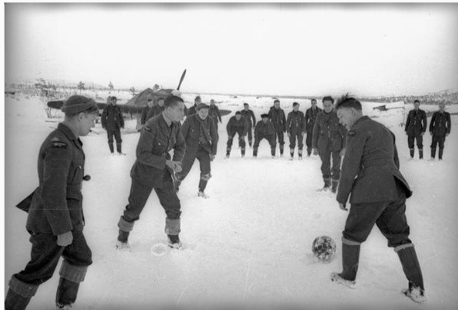
Товарищески й футбольный матч советских и английских летчиков. Заполярье. 1942