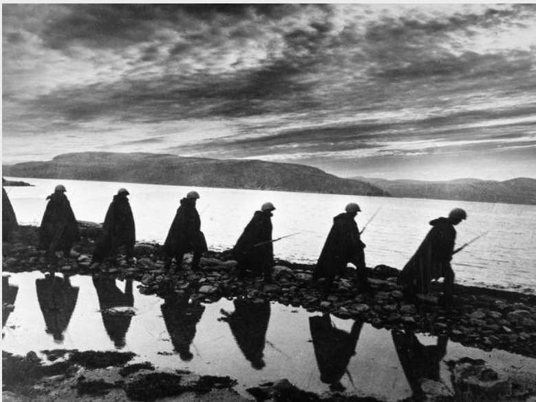
Ночная разведка. Заполярье. 1942