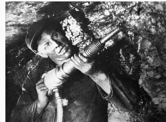
А л е к с е й С т а х а н о в , 1935 Г о д .

Евгений Халдей родился 23 марта 1917 в Юзовке (теперь Донецк). Во время еврейского погрома 13 марта 1918 были убиты его мать и дед, а сам годовалый ребёнок получил пулевое ранение в грудь. Учился в хедере, с 13 лет начал работать на заводе. Первый снимок сделал в 13 лет самодельным фотоаппаратом. С 16 лет начал работать фотокорреспондентом. С 1939 он корреспондент «Фотохроники ТАСС». Снимал Днепрострой, репортажи об Алексее Стаханове.