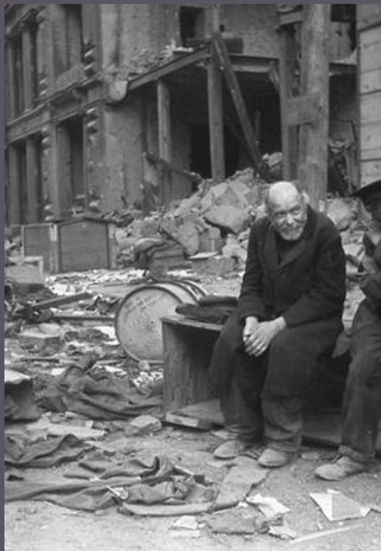
Б е р л и н . 1945

Представлял редакцию ТАСС на военно-морском флоте во время Великой Отечественной Войны. Все 1418 дней войны он прошёл с камерой « Leica III » от Мурманска до Берлина .