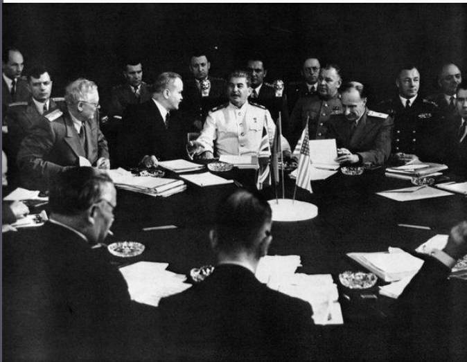
Потсдамская конференция. 1945

Снял Парижское совещание министров иностранных дел, поражение японцев на Дальнем Востоке, конференцию глав союзных держав в Потсдаме, водружение флага над Рейхстагом, подписание акта капитуляции Германии.