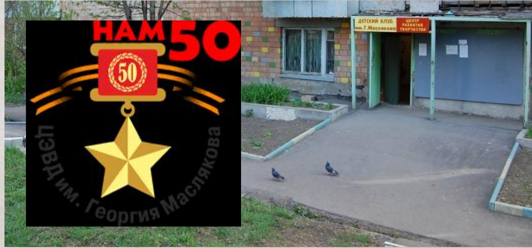
Центр эстетического воспитания детей им. Маслякова, ул. Володарского