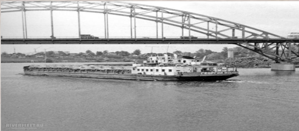
Сухогрузное судно им. Георгия Маслякова на Волге.