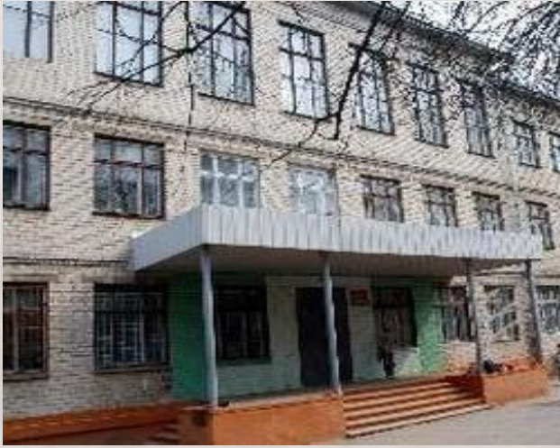
Школа № 175, ул. Героя Чугунова