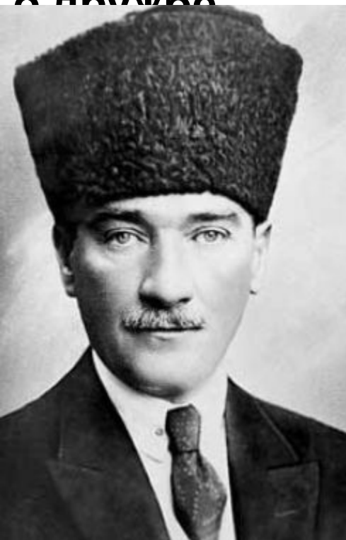
М. Кемаль (Отец турок - Ататюрк)

16 марта 1921 – Советско-турецкий договор