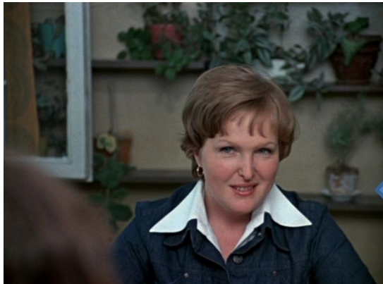
«Вам и не снилось» (1980 г.)

Лидия Михайловна — молодая учительница, которая, узнав о трудностях ученика, пытается решить их небольшой хитростью, рискуя при этом своей работой.