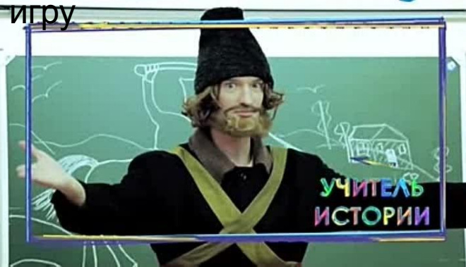
Сериал «Классная школа» (2013г)

Показан футбольный тренер, который смог замотивировать детей на успешную