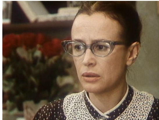
«Дорогая Елена Сергеевна» (1988 г.)

← Margarita Ivanovna играет в подружку своих детей, за поддельным вниманием стоит пустота. Она не успевает заметить во время как класс превратился в зверей, травящих одну девочку