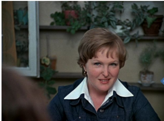
«Вам и не снилось» (1980 г.)

Лидия Михайловна — молодая учительница, которая, узнав о трудностях ученика, пытается решить их небольшой хитростью, рискуя при этом своей работой.