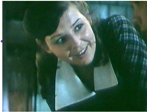
«Уроки французского» (1978 г.)

Из авторитарного и эгоистичного Нестор Петрович превращается в небезразличного и заботливого педагога. До этого погруженный в собственный мир, Нестор Петрович начинает жить заботами своих взрослых подопечных