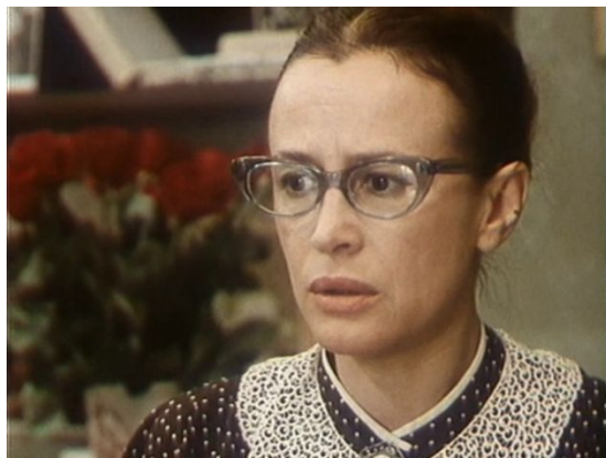
«Дорогая Елена Сергеевна» (1988 г.)

← Margarita Ivanovna играет в подружку своих детей, за поддельным вниманием стоит пустота. Она не успевает заметить во время как класс превратился в зверей, травящих одну девочку