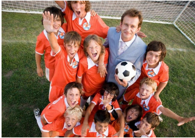
«Выкрутасы» (2011 г.)

Показан футбольный тренер, который смог замотивировать детей на успешную