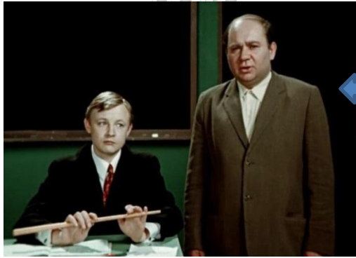
«Большая перемена» (1972 г.)

Из авторитарного и эгоистичного Нестор Петрович превращается в небезразличного и заботливого педагога. До этого погруженный в собственный мир, Нестор Петрович начинает жить заботами своих взрослых подопечных