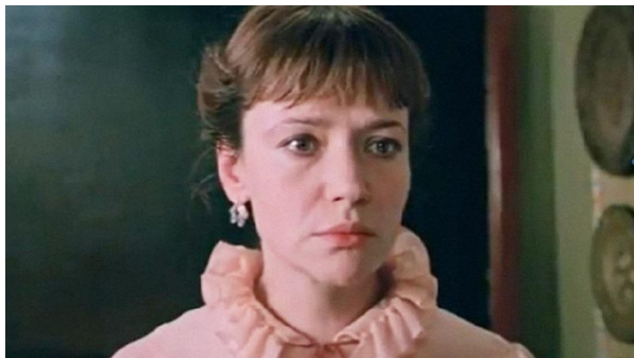
«Чучело» (1983 г.)

Образы учителей, не умеющих вовремя заметить проблемы или недостатки учеников.