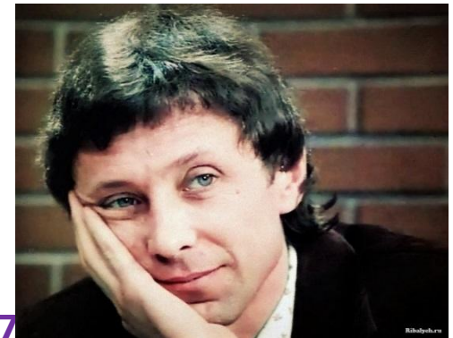
«Расписание на послезавтра» (1977 г.)

В самом начале фильма директор говорит фразу: «Мы строим школу будущего». Идея: каждый педагог должен видеть в ребенке личность и возвращать в ней стремление к познанию, убирая рамки запретов и осуждений.