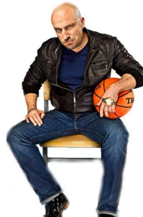
«Физрук» (2015 - 2017)

Учителя очень изобретательно преподают свои предметы. Они сами увлечены своим уроком и разными способами пытаются замотивировать детей, используют индивидуальный подход, могут грамотно выйти из самых затруднительных ситуаций