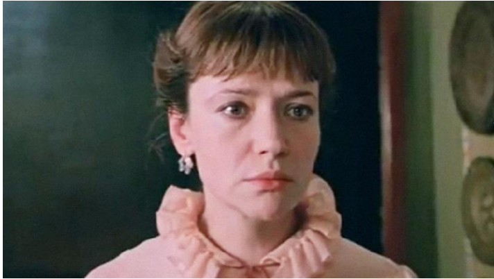
«Чучело» (1983 г.)

Образы учителей, не умеющих вовремя заметить проблемы или недостатки учеников.