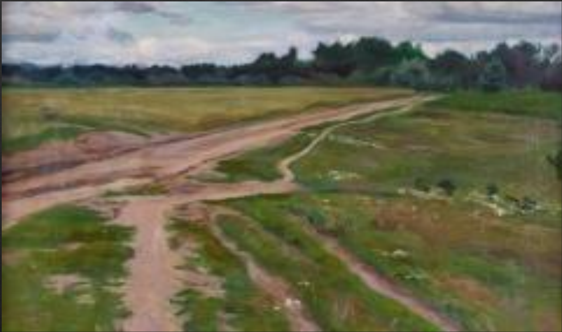
«Проселочная дорога к озеру Нарочь»(1956)