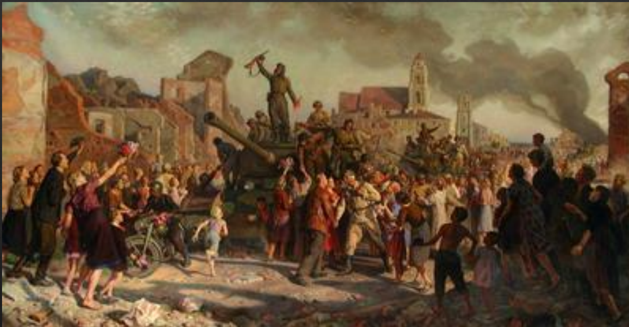
«Минск 3 июля 1944 года»