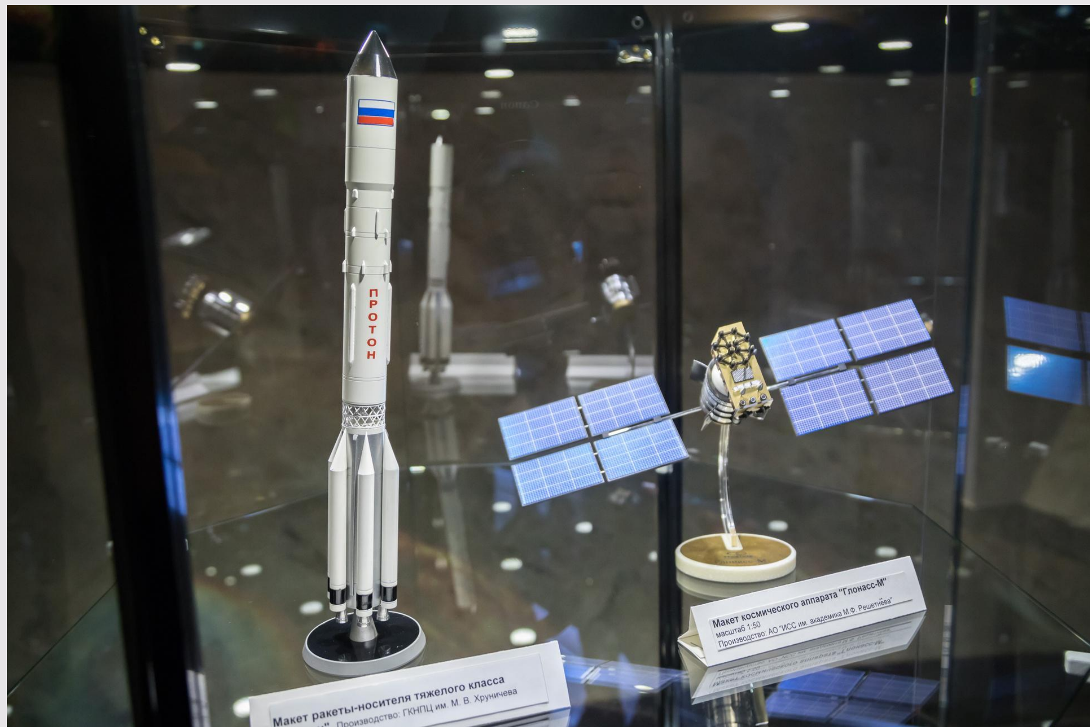
Макет ракеты-носителя тяжелого класса Производство: ГКНПЦ им. М. В. Хруничева

В музее много стеклянных витрин и ценных экспонатов. Я буду ходить аккуратно и не буду бегать