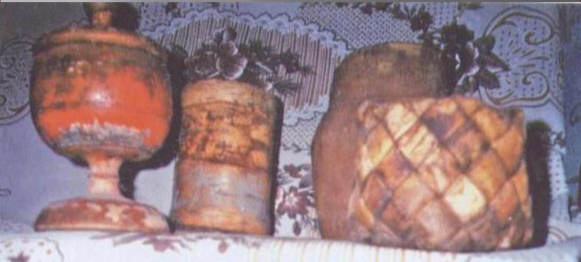
Солонка, тусок, берестяная корзина