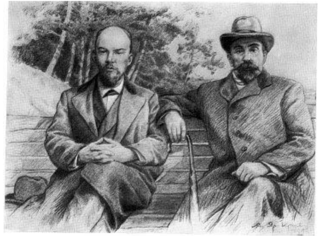
В. И. Ленин и Г. В. Плеханов Художник А. Яр-Кравченко

В 1903 году во время II съезда РСДРП, который открывался вступительной речью Плеханова, произошел раскол между «искровцами», «экономистами» и бундовцами.