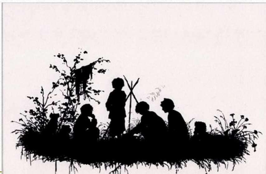
Бежин луг Е.Бем