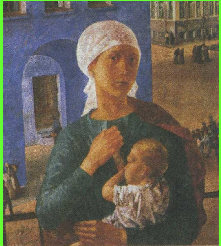
К. Петров-Водкин. 1918 год в Петрограде. 1920 г.

Советское многонациональное искусство стало оплотом реализма. Сразу же после революции 1917 г. молодое государство для пропаганды новых идей стремилось опереться на искусство. Оно стало частью новой советской идеологии. Мастера живописи, скульптуры, графики прославляли революционный порыв народа и его созидательный труд. Особое внимание уделялось монументальной пропаганде — возведению памятников деятелям мировой революции и культуры. В 1957 г. образуется единый Союз художников СССР, который помогает развитию талантов во всех национальных республиках. В то же время метод социалистического реализма (искусство социалистическое по содержанию и национальное по форме) признавался единственно возможным. Все течения в искусстве, которые ему не соответствовали, подвергались запрету.