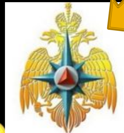
Войска ГО МЧС России