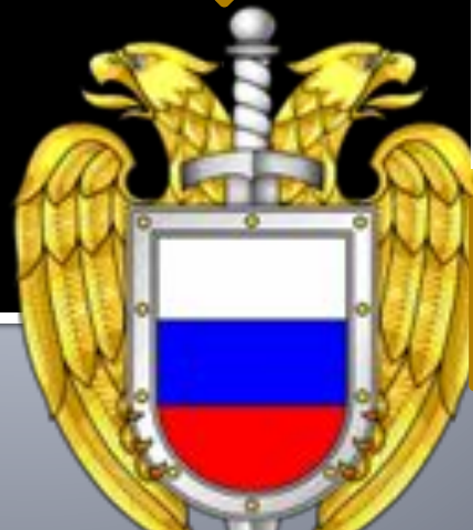
Федеральная служба охраны