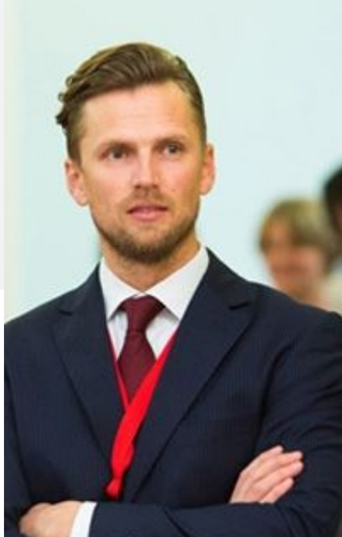
Авторы: Президент, CASE специалист по Беларуси Сергей Народский