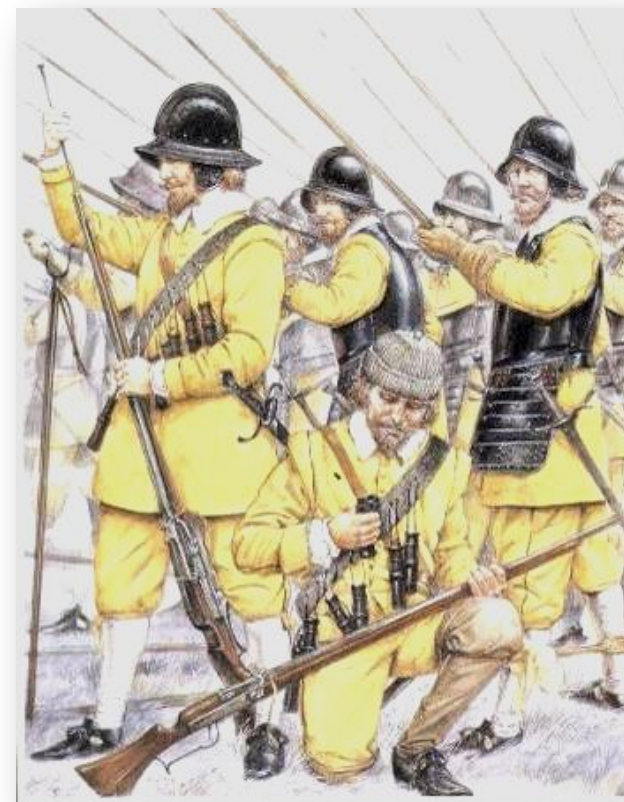
Солдаты «Желтой» бригады одного из основных подразделений шведов в битве при Лютцене 1632 год.