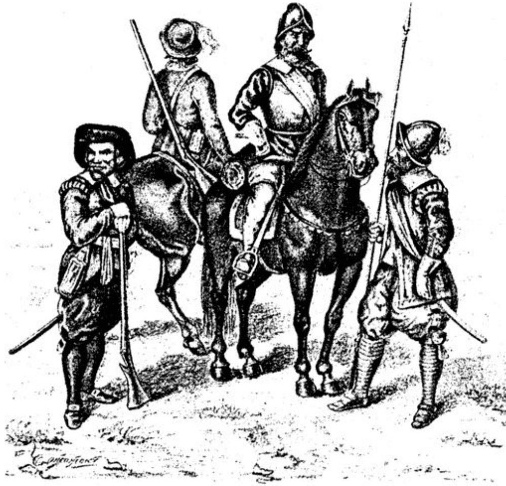
Шведские войны эпохи Густава-Адольфа (слева направо): мушкетер, драгун, кирасир, пикинер