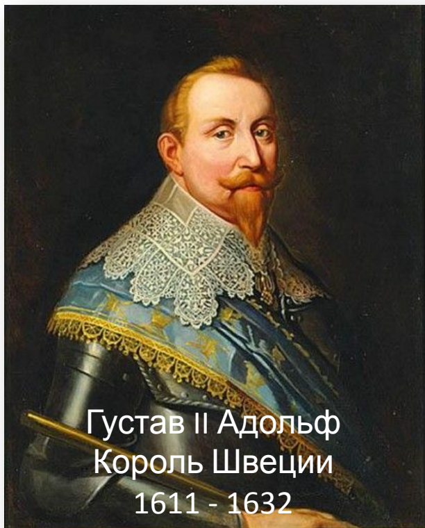
Густав II Адольф Король Швеции 1611 - 1632

Это опять подняло на борьбу протестантских князей, которым наибольшую помощь оказал кардинал Ришелье, так как для Франции была опасна сильная Германия.