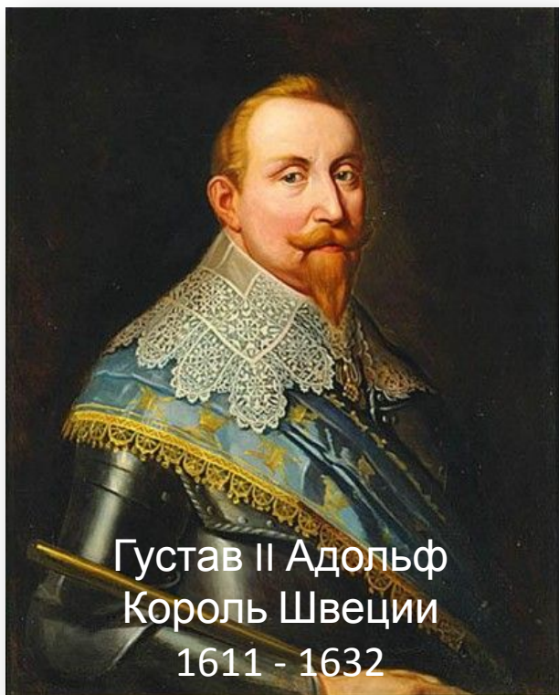
Густав II Адольф Король Швеции 1611 - 1632

Это опять подняло на борьбу протестантских князей, которым наибольшую помощь оказал кардинал Ришелье, так как для Франции была опасна сильная Германия.