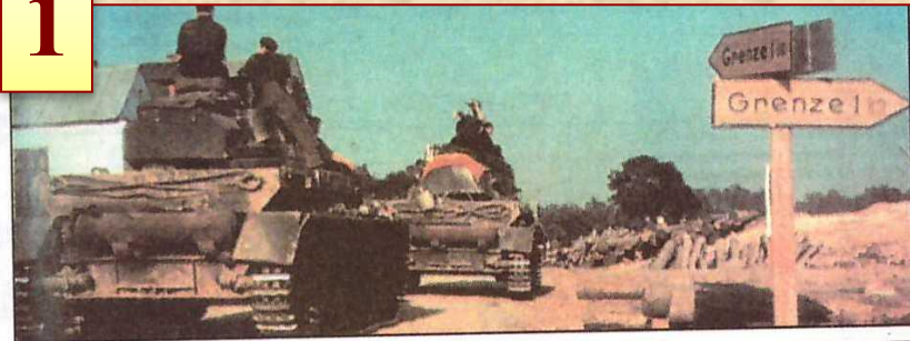
Начало Великой Отечественной войны