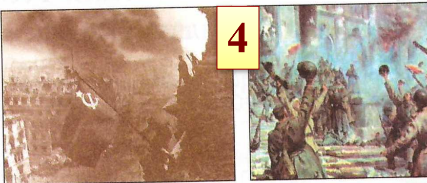
Взятие Берлина советскими войсками