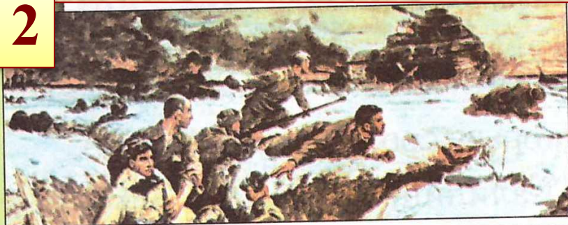
Битва за Москву