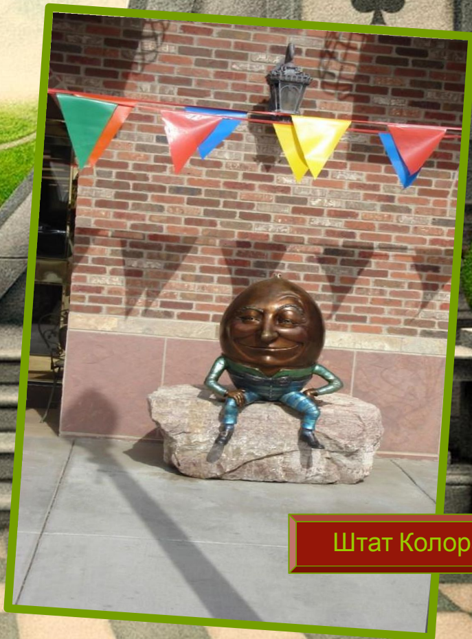
Штат Колорадо, США