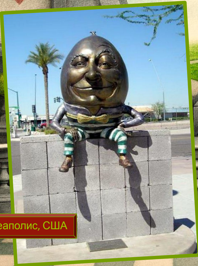
г. Миннеаполис, США