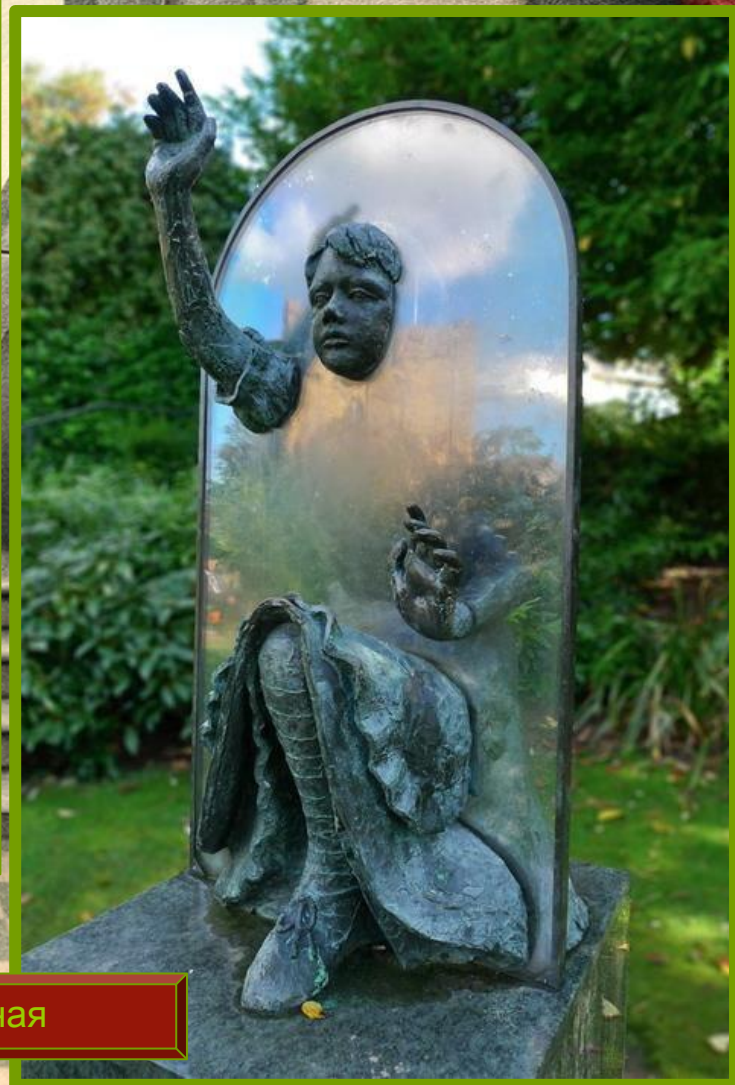
г. Гилдфорд, Юго-Восточная Англия