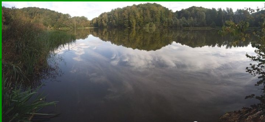
■ карстовое озеро Самурское