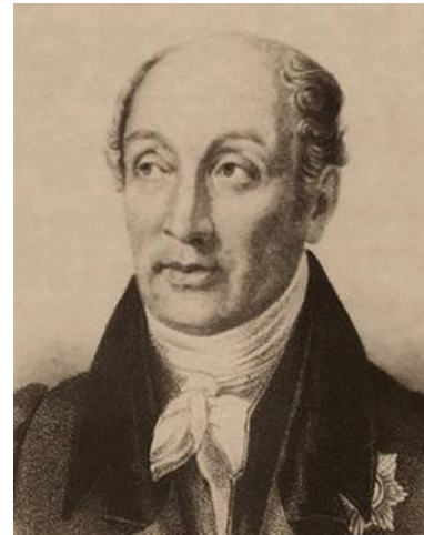
М.М. Сперанский, преподаватель права.