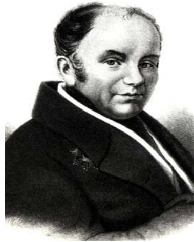
Поэт В.А. Жуковский, наставник