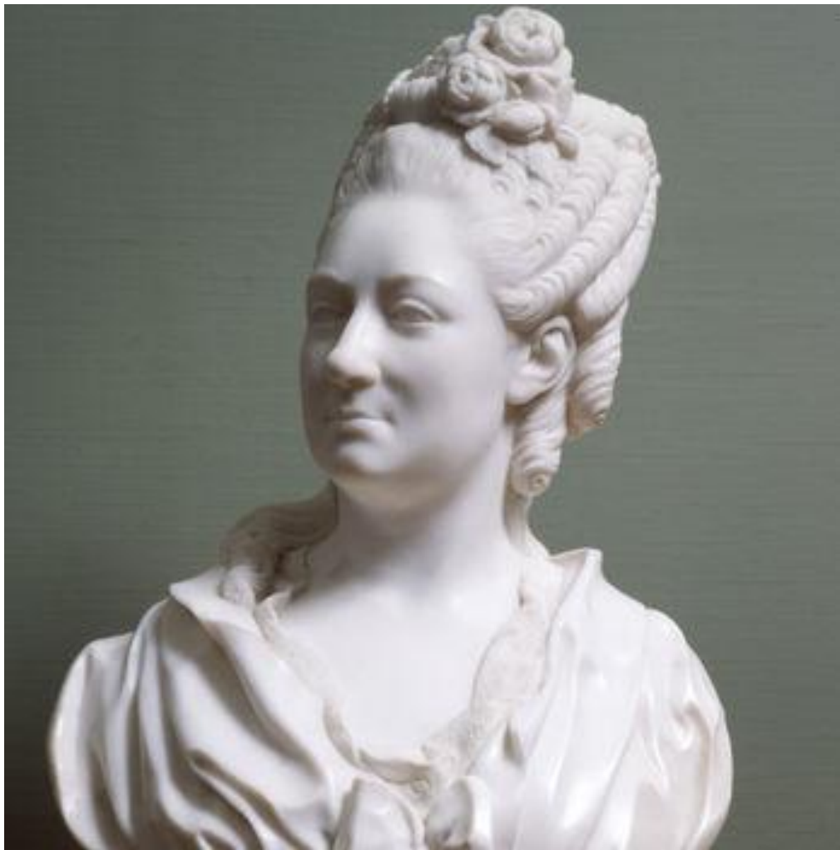
Портрет М.Р.Паниной. (сер. 70-х г.г. XVIII в.)