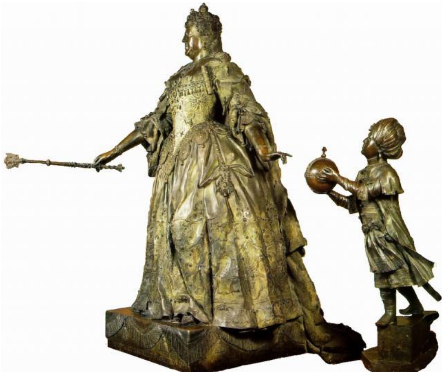
Анна Иоанновна с арапчонком.