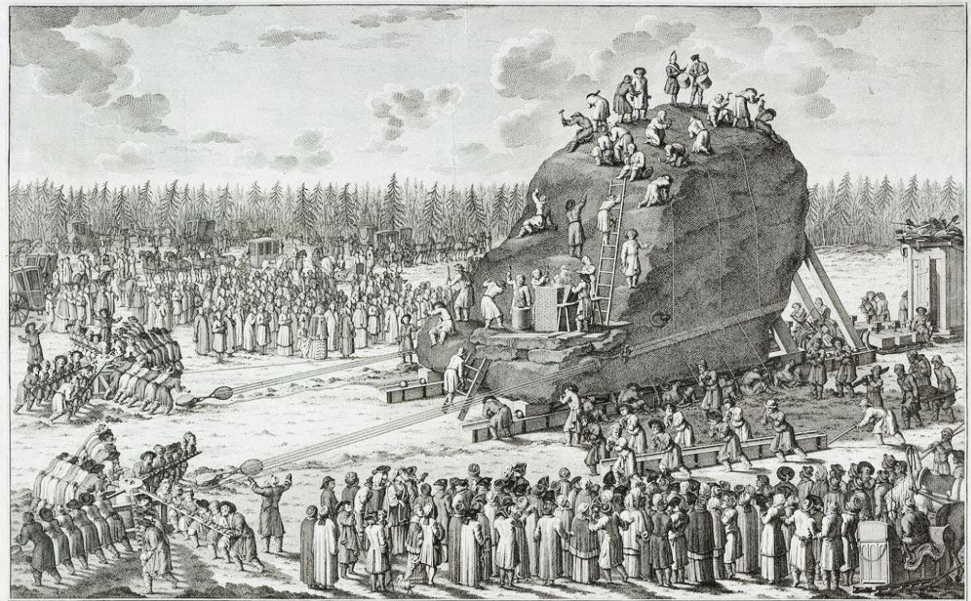
Видъ камені грома, во время переноса ея въ монастырь. Екатериніны вторыя. Мѣсяцъ 20 й 1770 го года.