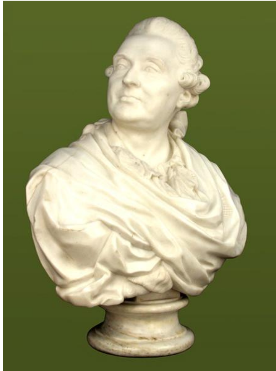
Бюст - портрет князя А.М. Голицына. Мрамор. 1774