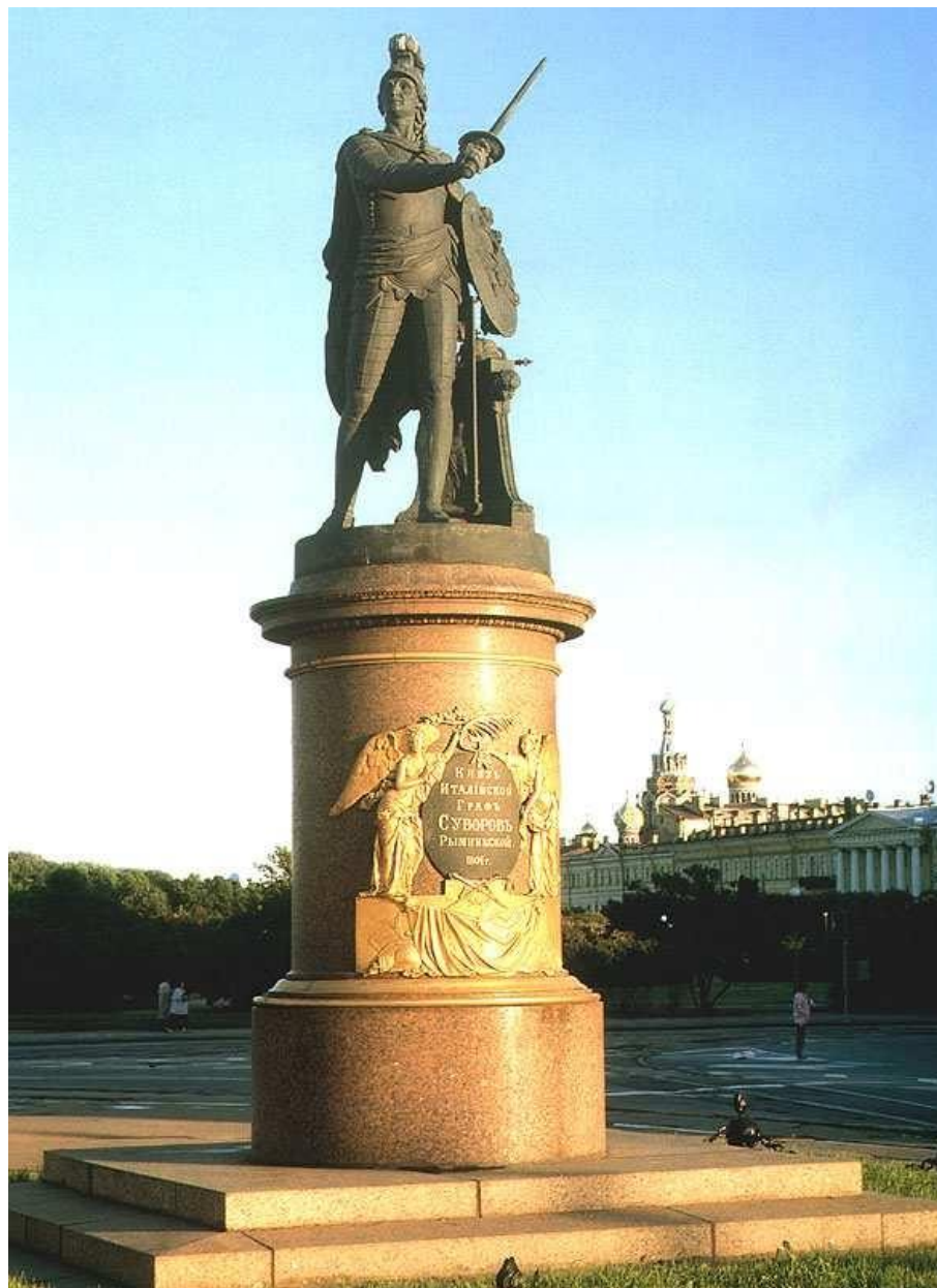
Памятник А.В.Суворову (1799-1801 г.г.)