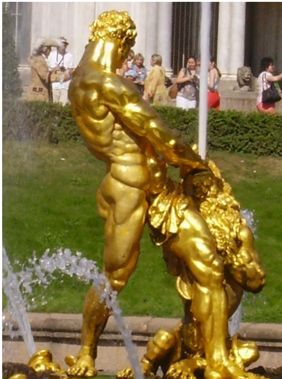
Самсон, разрывающий пасть льва (1800-1802 г.г.)