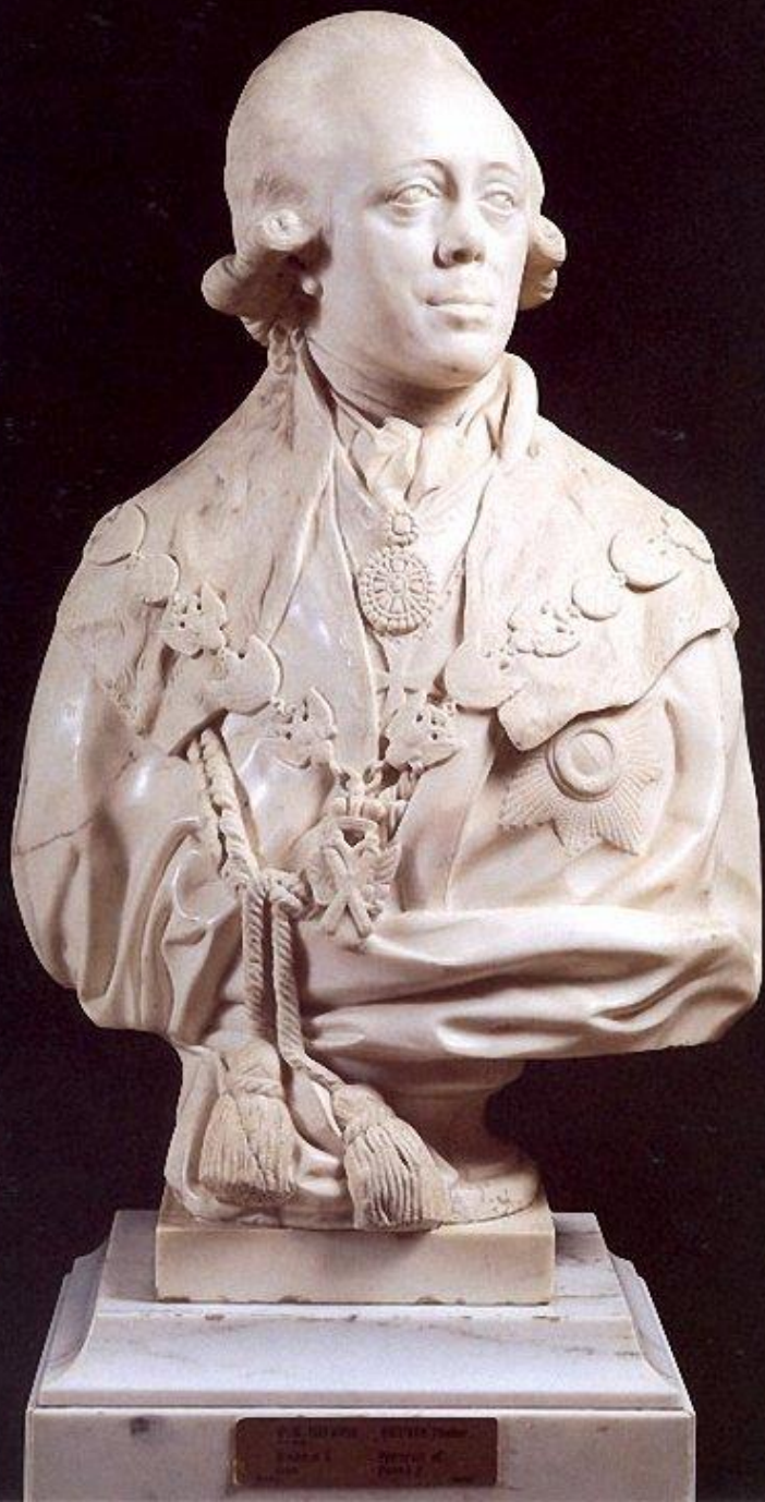
Портрет Павла I (1798 г.)