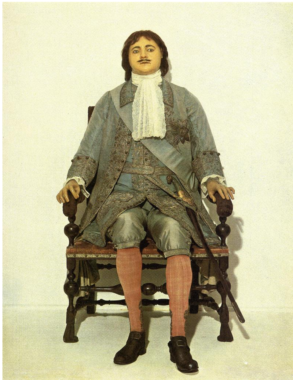
Восковая персона Петра I.