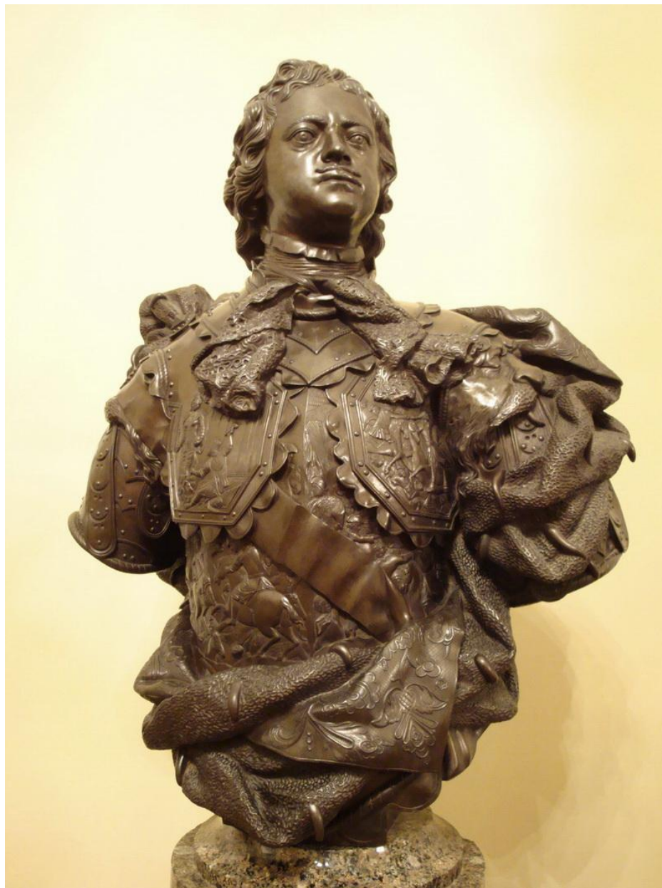
Бронзовый бюст Петра I