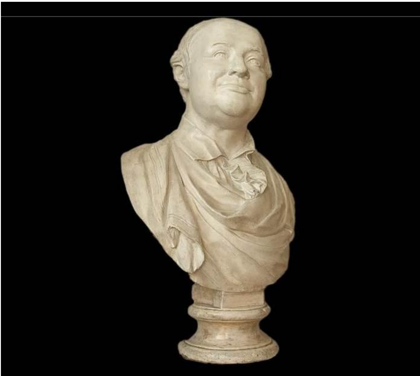
Бюст - портрет ученого М.В. Ломоносова. Гипс.