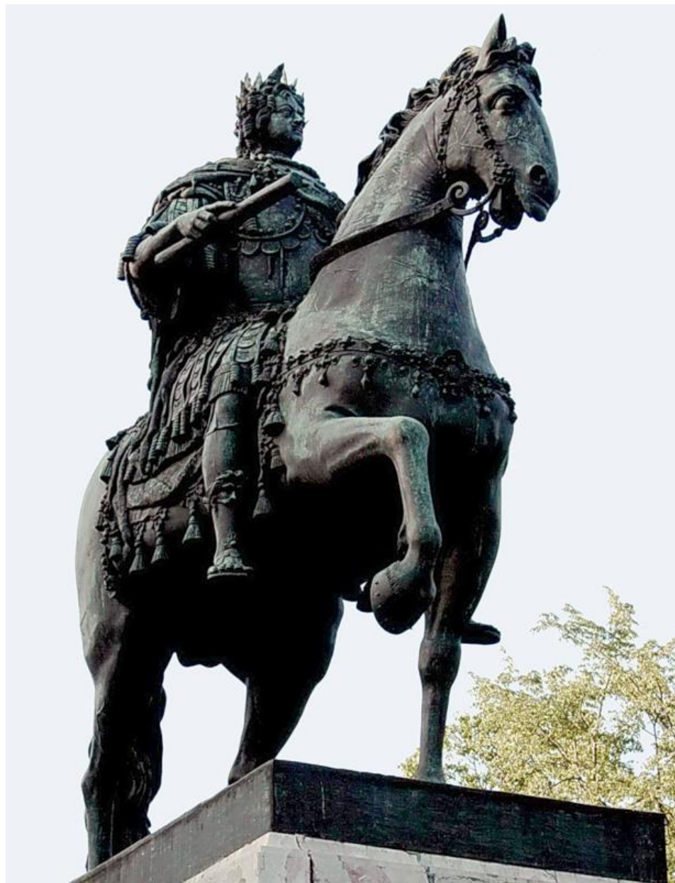
Конный памятник Петру I. 1720-1724 г.г.