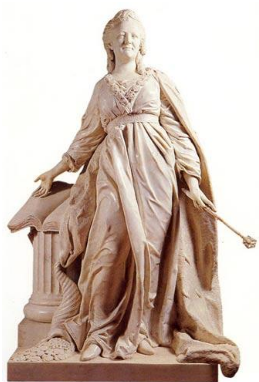
Екатерина II - Законодательница. Мрамор. 1789-1790