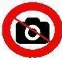
Фото, аудио и видеоаппаратуру