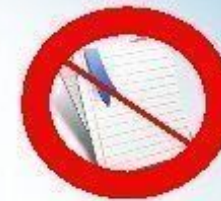
Справочные материалы, письменные заметки

* непрограммируемый калькулятор разрешается использовать на экзаменах по химии, биологии, физике, географии