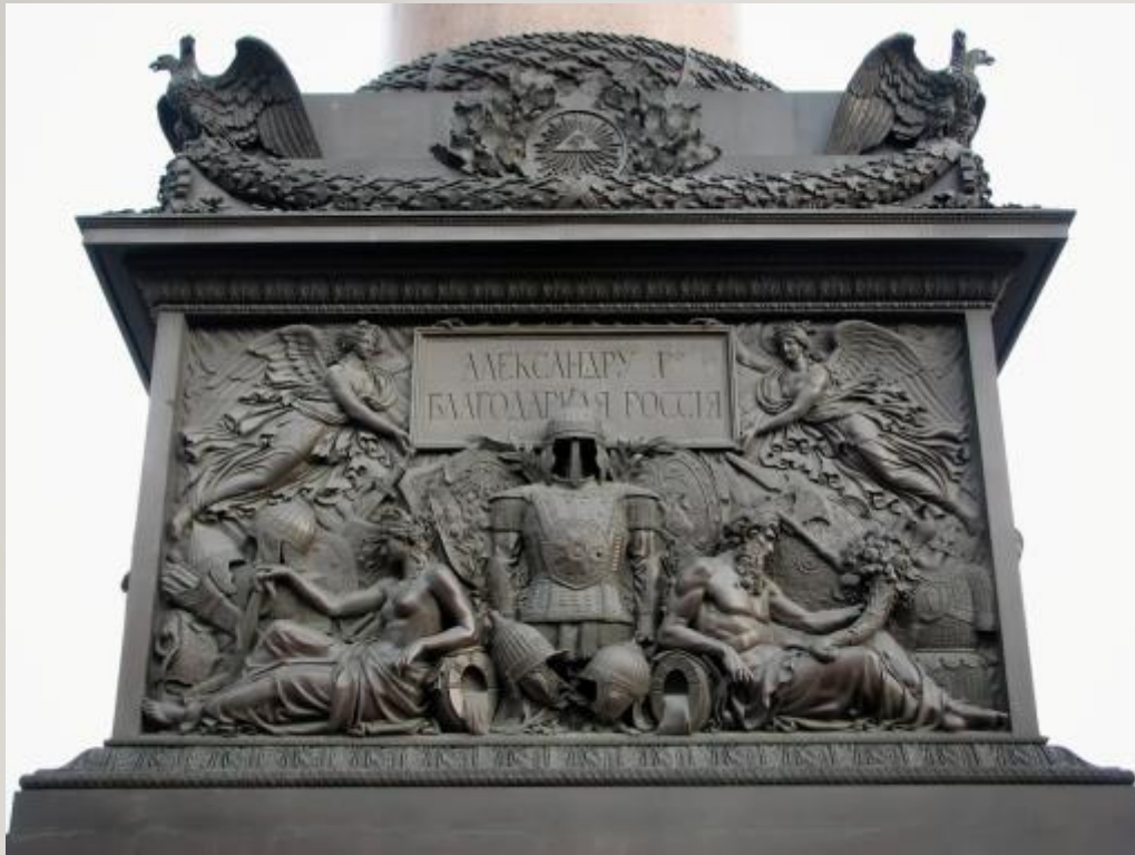
Барельеф пьедестала Александровской колонны.

I. Барельеф (фр. bas-relief — низкий рельеф) - изображение на плоскости, в котором фигура выступает из фона менее, чем на половину.