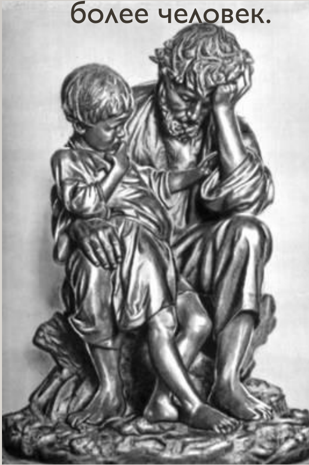
Чижов М. А. Крестьянин в беде.

Группа – скульптурное изображение двух и более человек.