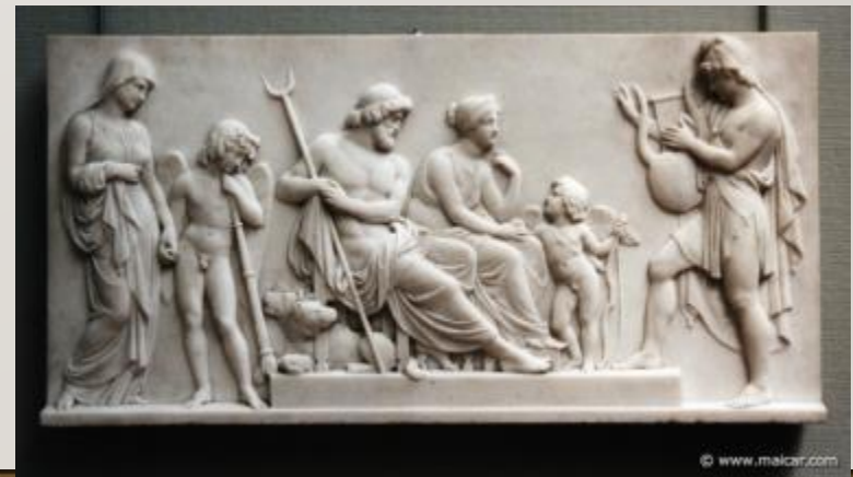
Орфей, играющий для Аиды и Персефоны.