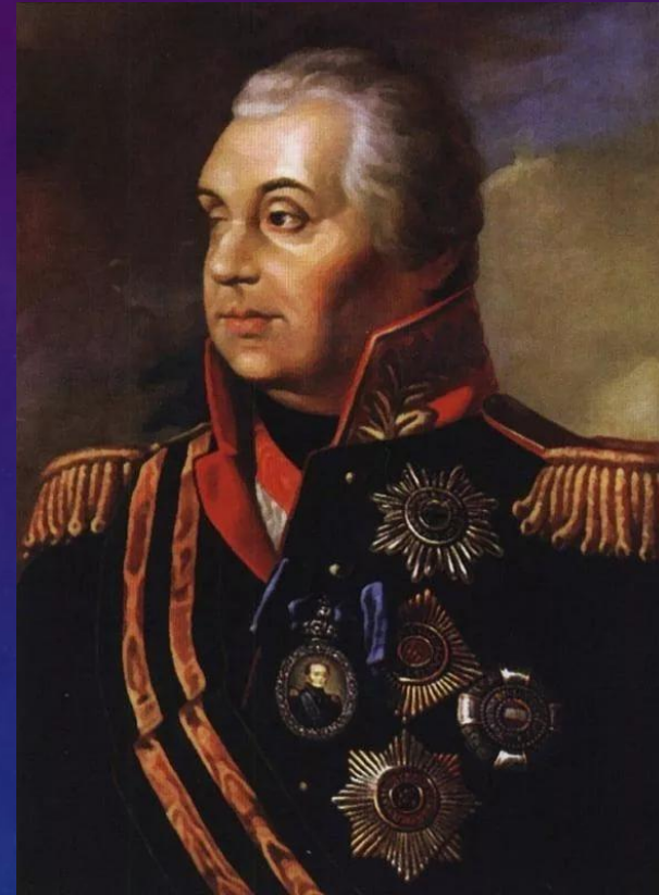
Михаил Кутузов - великий полководец. Родился и подолгу жил в Санкт-Петербурге. Сражался против Наполеона в Отечественную войну 1812г. Похоронен в Казанском соборе.