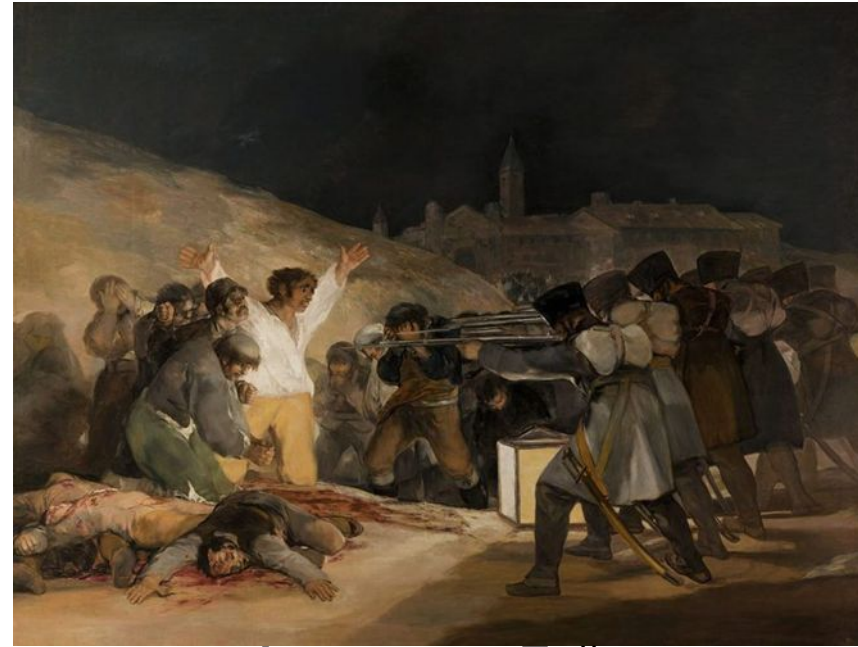
Франсиско Гойя «Расстрел повстанцев»

«Романтизм есть не что иное, как апофеоз личности» (Иван Тургенев).