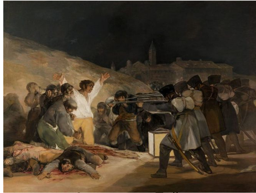
Франсиско Гойя «Расстрел повстанцев»

«Романтизм есть не что иное, как апофеоз личности» (Иван Тургенев).