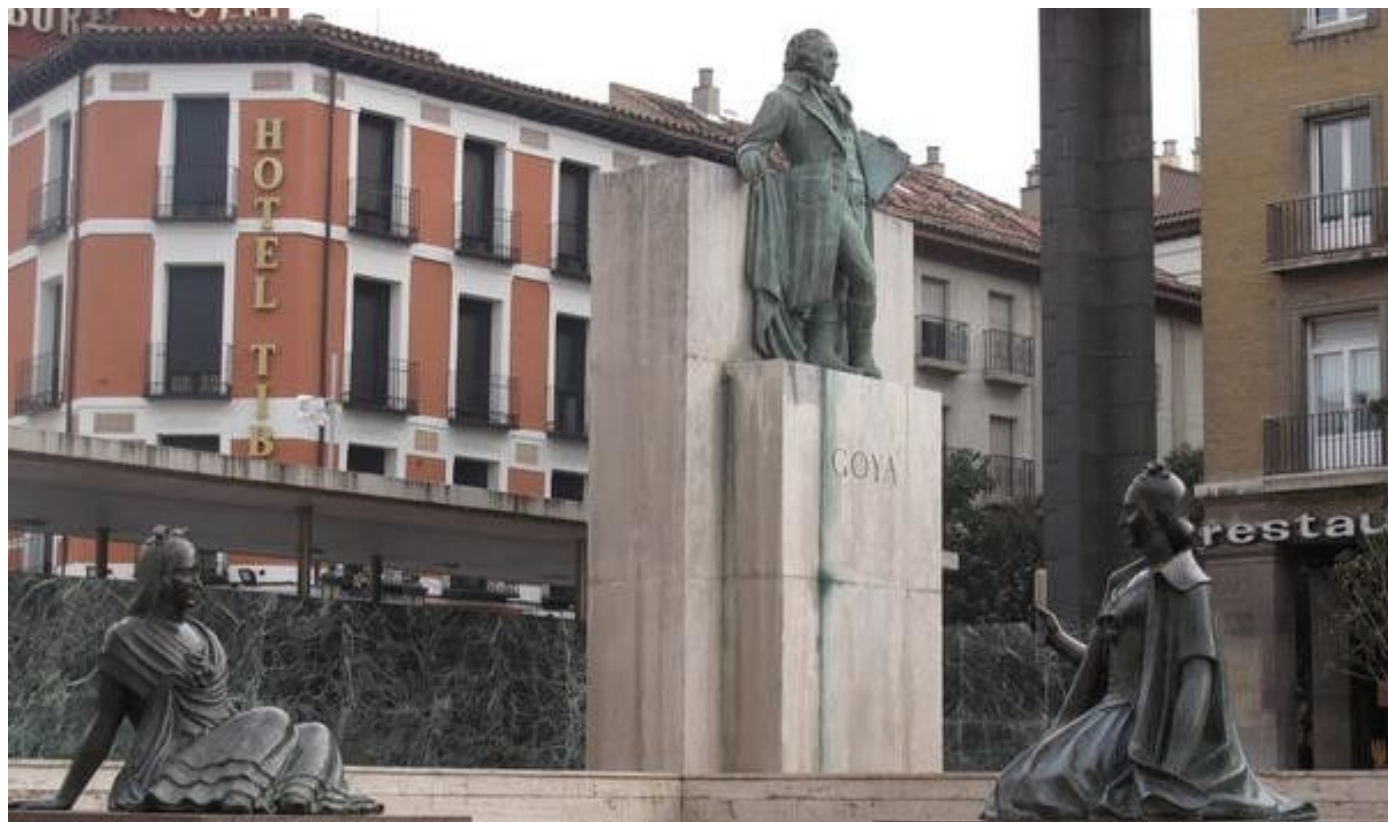
Памятник Франсиско Гойе в Сарагосе