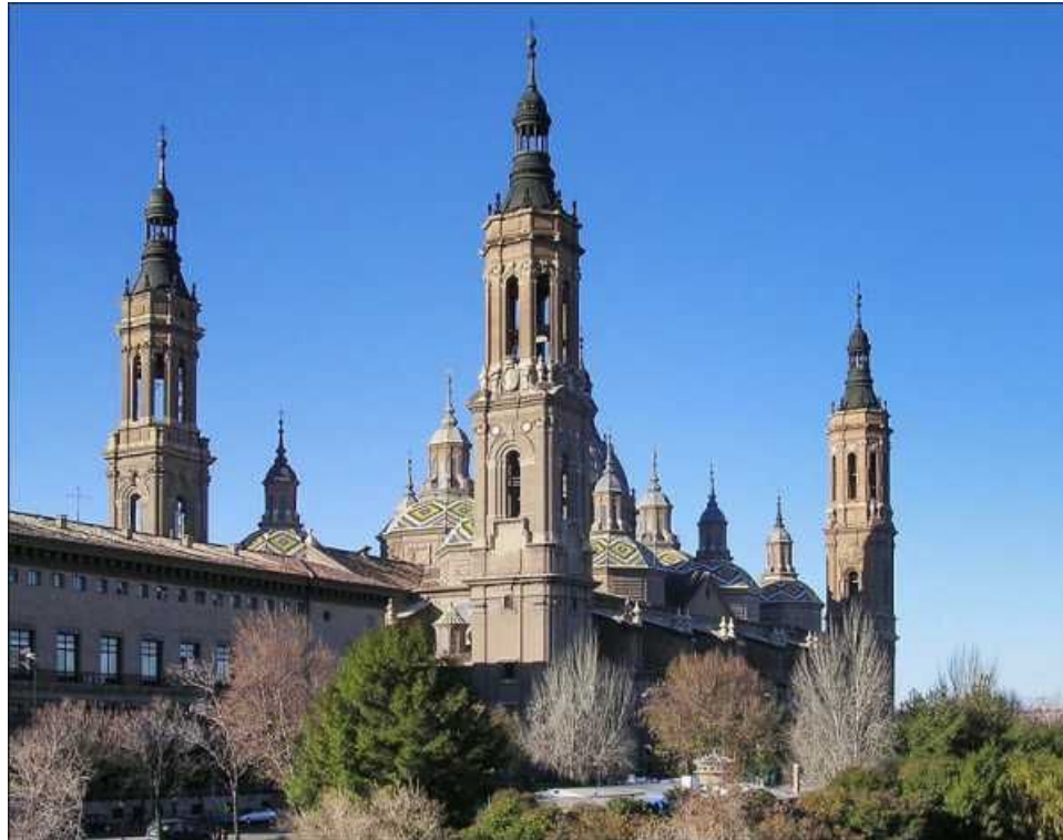
Собор Мадонны Пилар

Из Италии художник вернулся в Сарагосу. Он участвует в росписи главного храма города – собора Мадонны Пилар. Сегодня на главной площади Сарагосы, недалеко от собора, красуется памятник Гойе. Фрески художника покорили заказчика и принесли мастеру признание. Он переехал в Мадрид и начал получать многочисленные заказы.