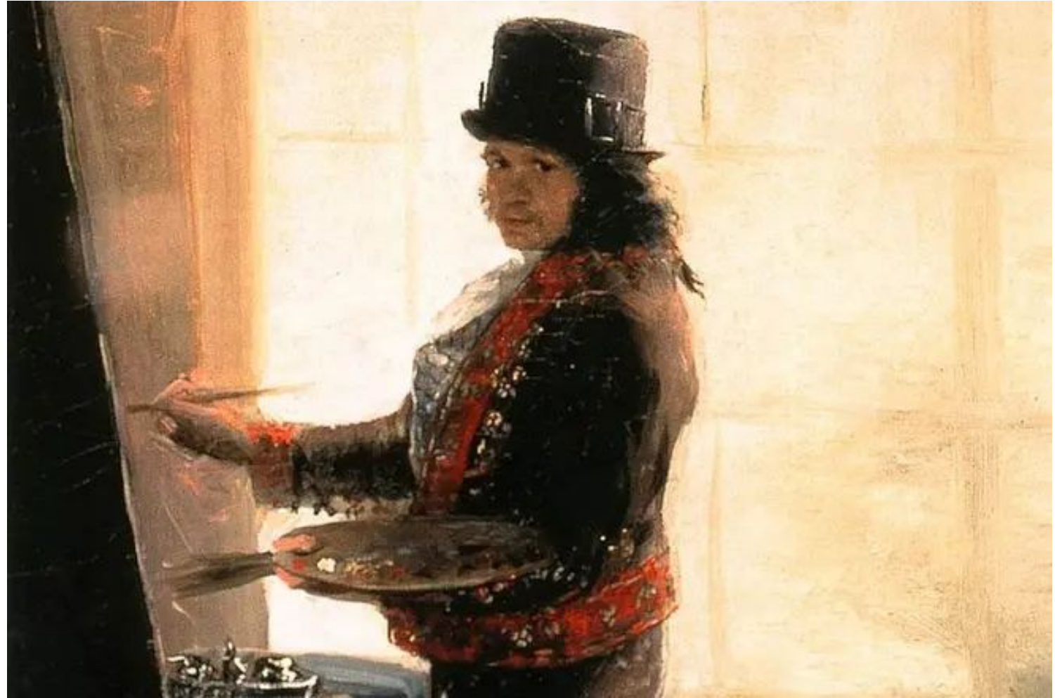
«Автопортрет» Франсиско Гойи

- испанский живописец и гравёр, один из первых и наиболее ярких мастеров изобразительного искусства эпохи романтизма . Жизнь художника была полна страданий. Колоссальное трудолюбие позволило ему работать до глубокой старости, невзирая на тяжелую болезнь, полную глухоту. Жизнь Гойи пришлась на время зверств инквизиции, ее жертвами стали многие друзья художника. Из пяти испанских революций Гойя стал свидетелем двух, на его глазах страна восстала против Наполеона, была отменена и вновь восстановлена ненавистная ему инквизиция.