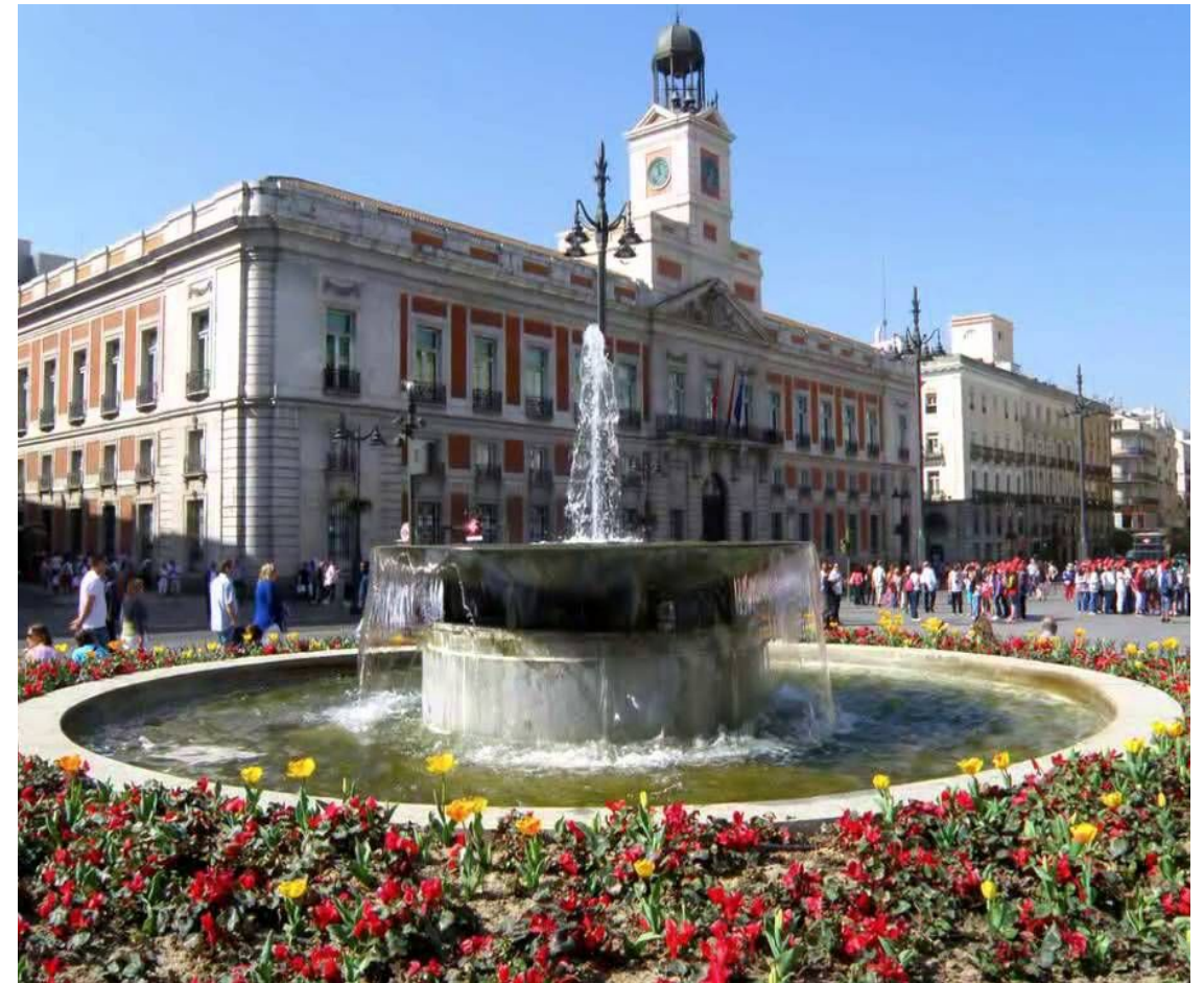
Королевская академия изящных искусств Сан-Фернандо