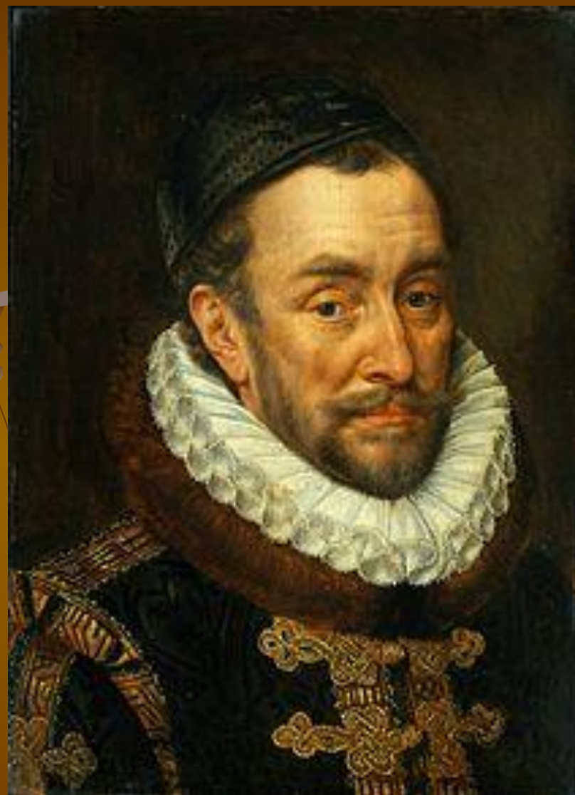
Вильгельм I Оранский считается основателем независимых Нидерландов.

территория была заселена различными палеолитическими Первыми археологические свидетельства пребывания древнего человека на территории нынешних Нидерландов относятся к нижнему палеолиту (около 250 тыс. лет назад). Первые жители были охотниками и собирателями. В конце ледникового периода территория была заселена различными палеолитическими группами. Около 8000 лет до нашей эры в стране проживало мезолитическое Первыми археологические свидетельства пребывания древнего человека на территории нынешних Нидерландов относятся к нижнему палеолиту (около 250 тыс. лет назад). Первые жители были охотниками и собирателями. В