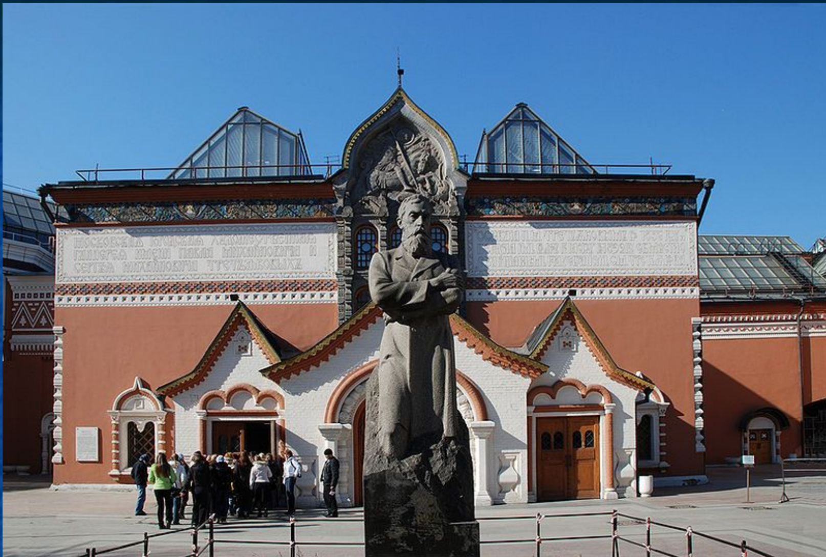
Художественный музей в Москве, основанный в 1856 году купцом Павлом Третьяковым