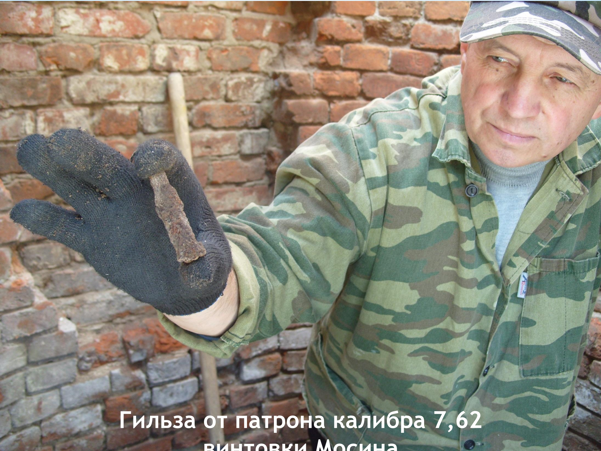
Гильза от патрона калибра 7,62 винтовки Мосина