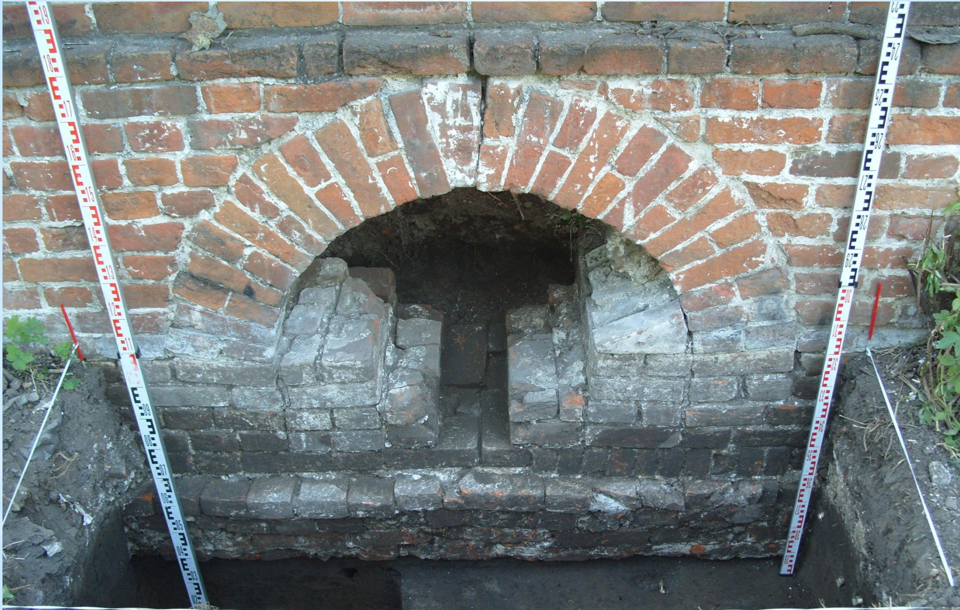
Вид дренажа после расчистки: