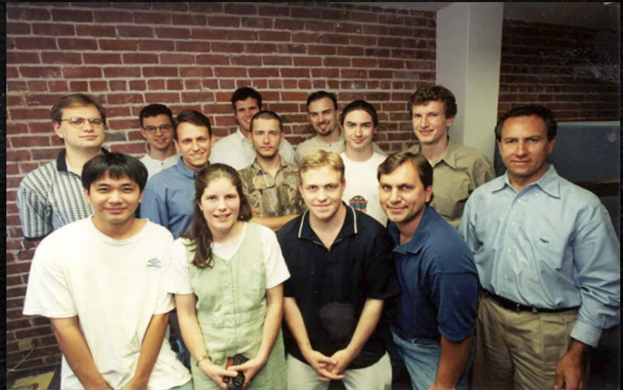
Сотрудники компании PayPal

По состоянию на 2018 год PayPal работает в 202 странах, имеет более 200 млн зарегистрированных пользователей, работает с 25 национальными валютами.